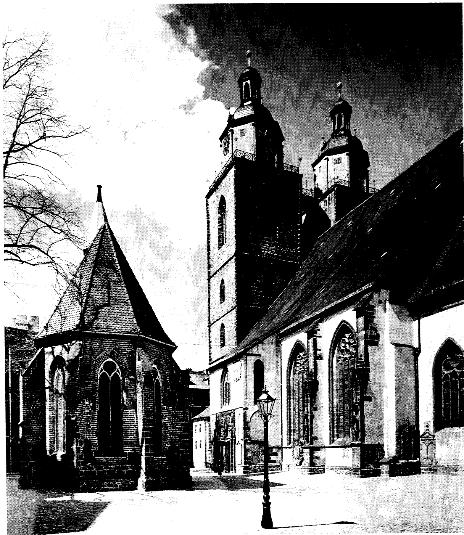
Wittenberg : église de la ville et chapelle du Corpus Christi Wittenberg : the Town Church with Corpus Christi chapel