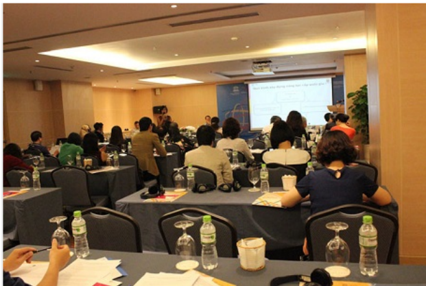
Toàn cảnh buổi hội thảo

Chương trình Hội thảo và Tập huấn này nằm trong khuôn khổ dự án của UNESCO và Chính phủ Thụy Điển hỗ trợ nhằm triển khai nâng cao năng lực thực hiện Công ước UNESCO về việc bảo vệ và phát huy sự đa dạng của các biểu đạt văn hoá.