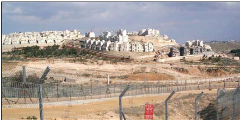
Израильское поселение Модиин на Западном берегу, март–апрель 2006 года.