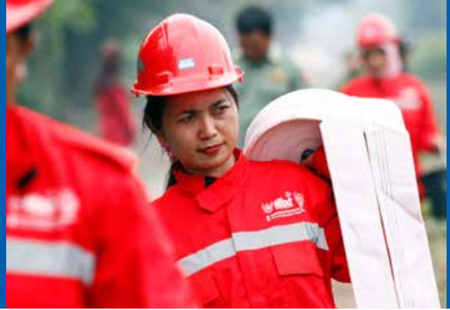
Pompiere durante un'esercitazione nel villaggio di Garantung, Palangkaraya, Kalimantan Centrale (Indonesia)

Le analisi qualitative provano che la partecipazione delle donne alla gestione delle risorse e delle infrastrutture idriche può migliorare l'efficienza e aumentare la produzione