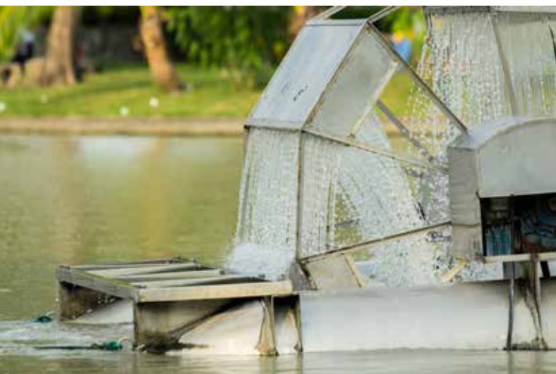
Aeratore a turbina Chaipattana in un parco pubblico (Tailandia)

La produzione di energia, prerequisito per lo sviluppo, permette la creazione di occupazione diretta e indiretta in tutti i settori dell'economia. Il settore energetico registra al contempo una crescita della domanda di energia, con particolare riferimento all'elettricità nelle economie in sviluppo ed emergenti, e una crescita dei prelievi idrici, a oggi pari a circa il 15% del totale a livello mondiale. La crescita del settore delle energie rinnovabili comporta un aumento dei posti di lavoro verdi e non dipendenti dalle risorse idriche.