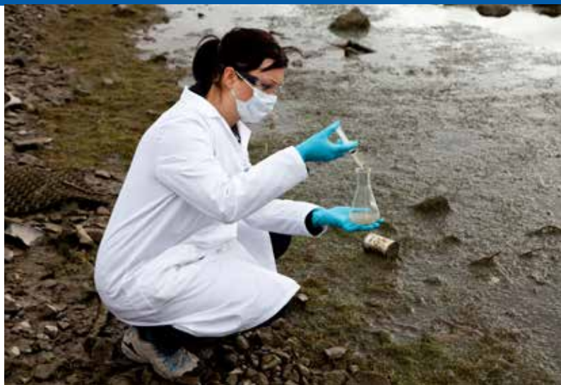
Valutazione dell'inquinamento ambientale

La mancanza di competenze e le sfide cui i settori correlati con l'acqua devono far fronte richiedono lo sviluppo di adeguati strumenti formativi e di approcci innovativi all'apprendimento, al fine di rafforzare le competenze del personale e migliorare le capacità istituzionali. Ciò vale per i governi e per le agenzie pubbliche, per le organizzazioni dei bacini idrografici e per altri gruppi, tra cui le organizzazioni del settore privato. Per far fronte a queste necessità è imprescindibile creare un ambiente politico che promuova l'istituzione di reti collaborative tra settore educativo, datori di lavoro del settore (pubblici, privati, ONG), organizzazioni sindacali e lavoratori; sviluppare incentivi per attirare e fidelizzare il personale; rafforzare la formazione tecnica e professionale; e porre attenzione allo sviluppo delle capacità delle risorse umane nelle aree rurali. Sono inoltre necessarie competenze nuove e trasversali al fine di rispondere alle nuove necessità.