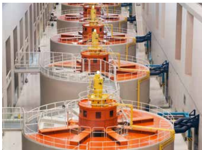
Generatori di energia idroelettrica

L'industria costituisce una fonte importante di posti di lavoro dignitosi in tutto il mondo e rappresenta un quinto della forza lavoro a livello mondiale. I settori industriale e manifatturiero rappresentano circa il 4% dei prelievi di acqua a livello globale; secondo le previsioni, entro il 2050 il solo settore manifatturiero potrebbe registrare un incremento del 400% nell'utilizzo di acqua. Con il miglioramento della tecnologia industriale e grazie alla crescente consapevolezza del ruolo essenziale svolto dall'acqua nell'economia e delle sollecitazioni ambientali a carico di questa essenziale risorsa, il settore industriale sta finalmente approntando misure atte a ridurre l'utilizzo di acqua per unità prodotta, migliorando così in generale la produttività dell'acqua nel settore. La qualità dell'acqua è oggetto di un crescente interesse, in particolare nei settori a valle della catena produttiva. Il settore industriale si sta inoltre impegnando a promuovere il riutilizzo e il riciclaggio dell'acqua, attraverso il giusto abbinamento tra qualità dell'acqua e uso previsto, indirizzandosi verso una produzione più pulita, con potenziali vantaggi quali posti di lavoro ben retribuiti (per i lavoratori con più elevati livelli di qualifica) sia nel settore industriale sia per i fornitori di macchine per il trattamento.