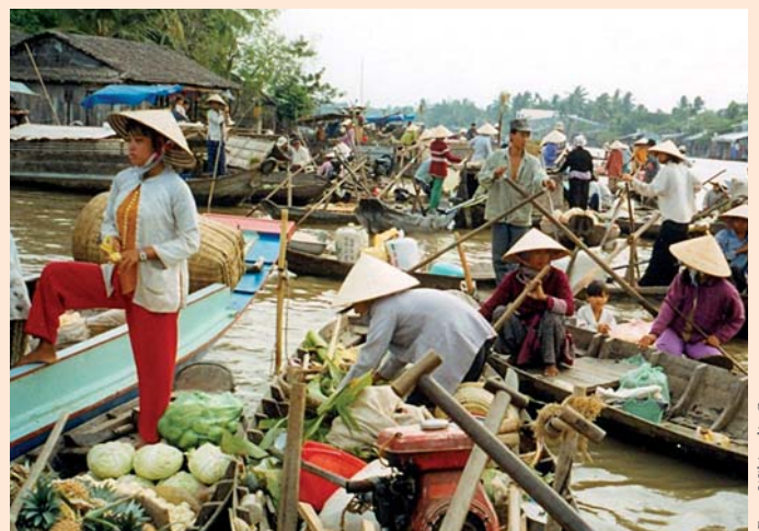
Mercado flotante de Cán Thó en Viet Nam, en el delta del Mekong

El 6 de noviembre de 2012, Laos anunció que había finalizado de introducir cambios en el proyecto y que seguiría adelante con la construcción de la represa.