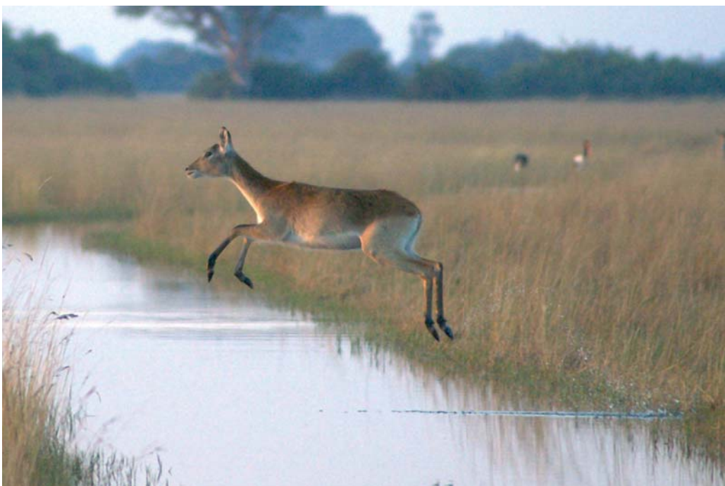
Antílope en el delta del Okavango en Botswana en 2005. Botswana comparte la cuenca del Okavango con Angola, Namibia y Zimbabwe. Las demandas de agua de Botswana para mantener el delta y su lucrativa industria de ecoturismo alimentan una controversia con Namibia, situada en la cuenca superior, que desea canalizar el agua que atraviesa la Franja de Caprivi para abastecer de agua potable a su capital.