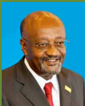
Getachew Engida Diretor-geral adjunto, UNESCO

A combinação desses elementos impulsionará a inovação e o desenvolvimento. A UNESCO trabalha em todas as partes do mundo para garantir que a construção dessas sociedades prossiga desimpedida. Desde sua fundação, em 1945, milhões de pessoas já se apoiaram no ativismo da UNESCO e usufruíram dele. Por meio de suas vozes, apresentadas nesta brochura, lembramos que a UNESCO é tão relevante hoje quanto foi em meados do século XX e que continua a transformar vidas e comunidades em todo o mundo.