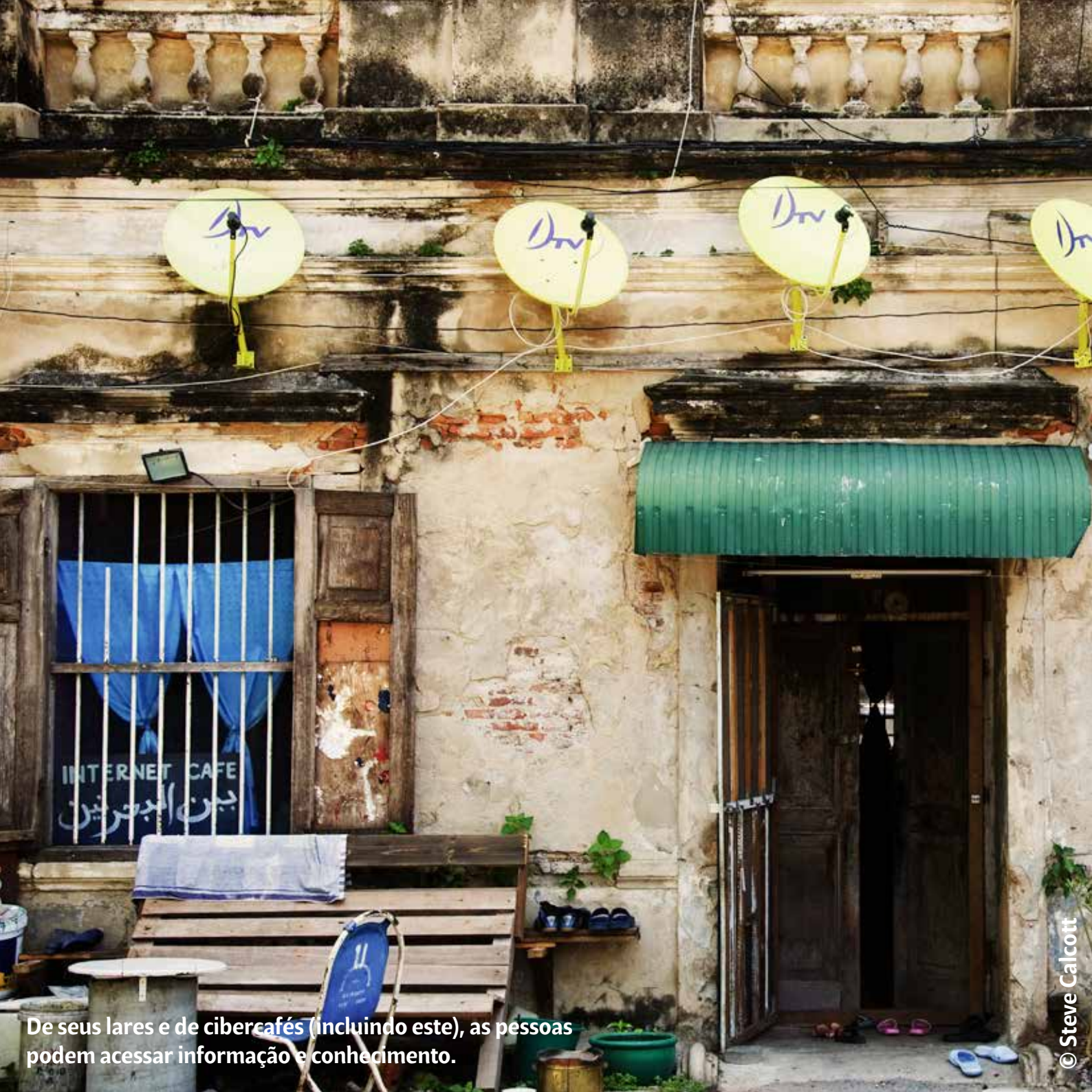
De seus lares e de cibercafés (incluindo este), as pessoas podem acessar informação e conhecimento.