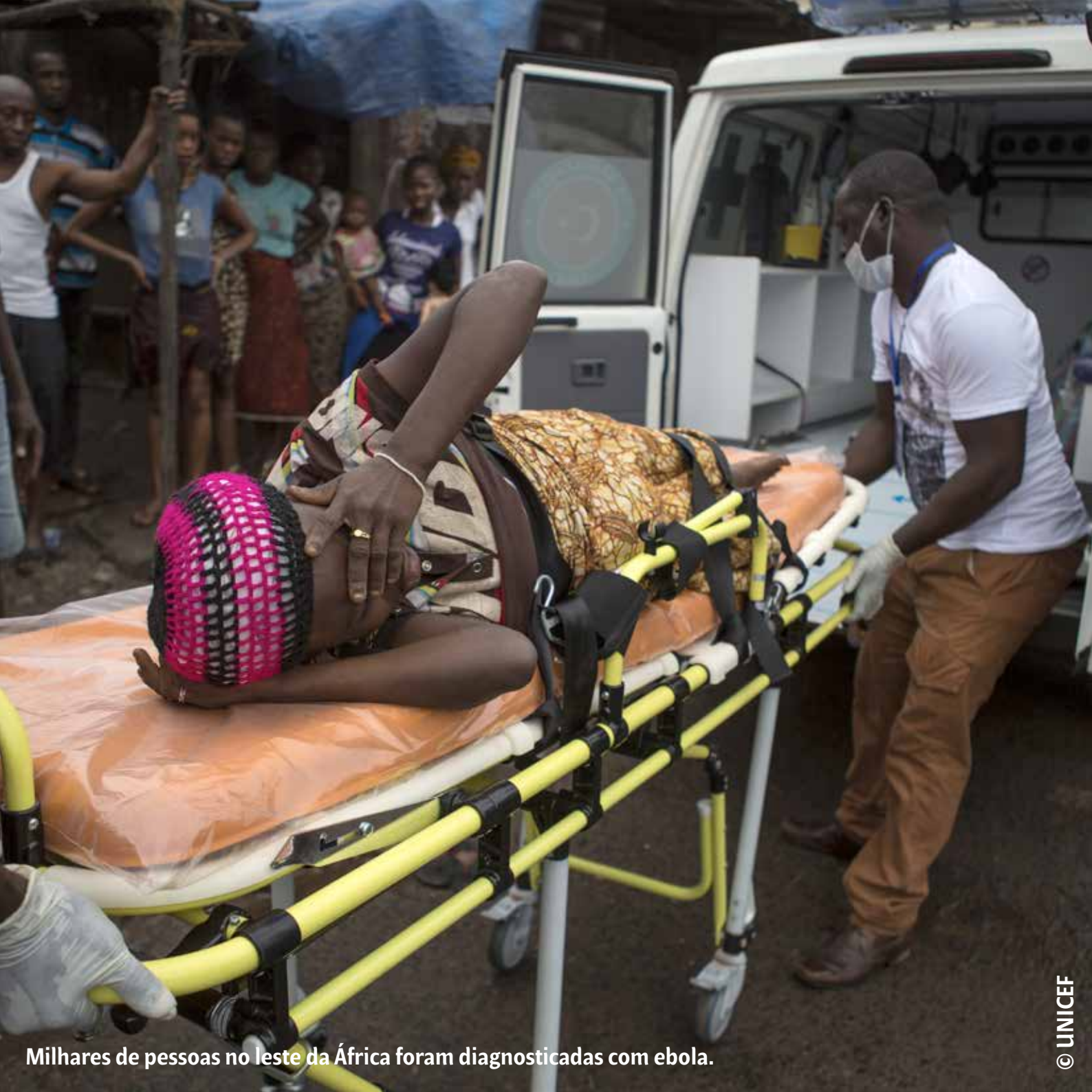
Milhares de pessoas no leste da África foram diagnosticadas com ebola.