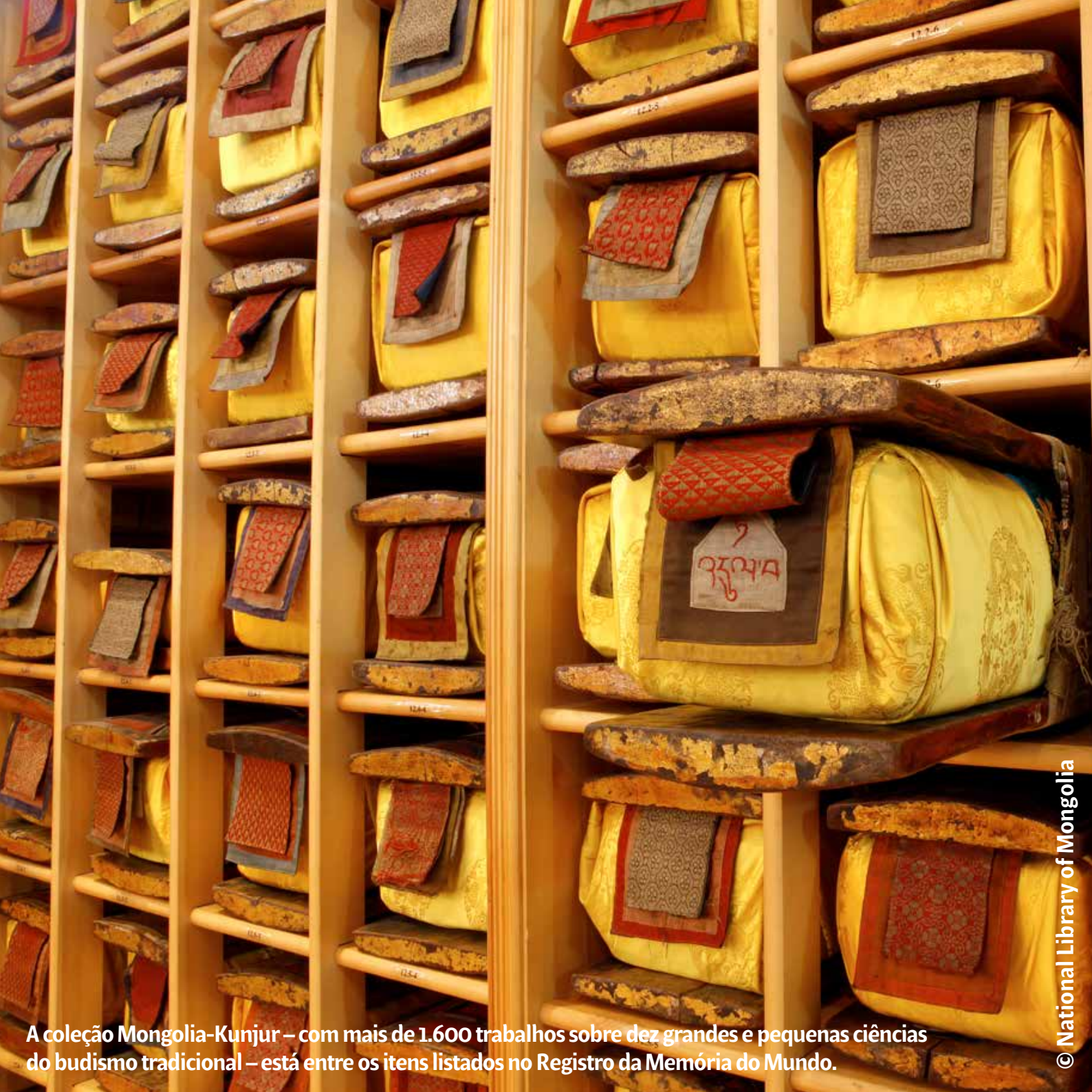
A coleção Mongolia-Kunjur – com mais de 1.600 trabalhos sobre dez grandes e pequenas ciências do budismo tradicional – está entre os itens listados no Registro da Memória do Mundo.