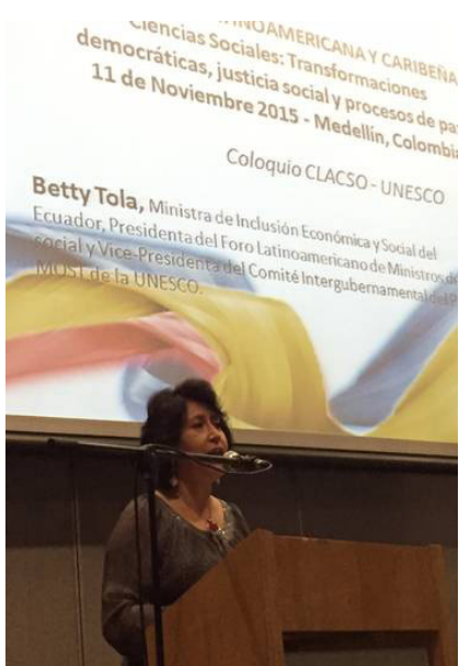
Betty Tola, Ministra de Inclusión Económica y Social del Ecuador

Charaf Ahmimed, especialista del Sector de Ciencias Sociales y Humanas, de UNESCO Centroamerica, moderó la conferencia CLACSO sobre "Cooperación popular y economías solidarias", el Seminario "Gestión de Transformaciones sociales (MOST)" y el un panel sobre inclusión social titulado "Abriendo fronteras: transformación social en áreas urbanas vulnerables"