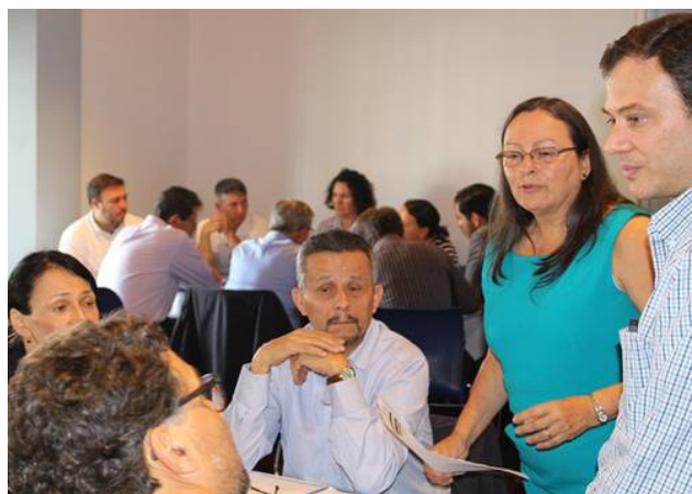
Conversatorio Caudal ambiental: definición, administración y normativa en Costa Rica