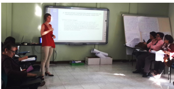
Talleres "La Enseñanza del Respeto para Todos", Honduras.