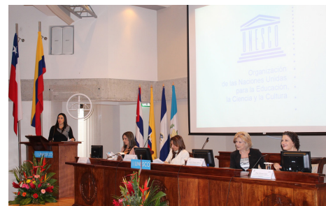
Apertura de la Conferencia "Vinculando a los varones con el logro de la igualdad de género"