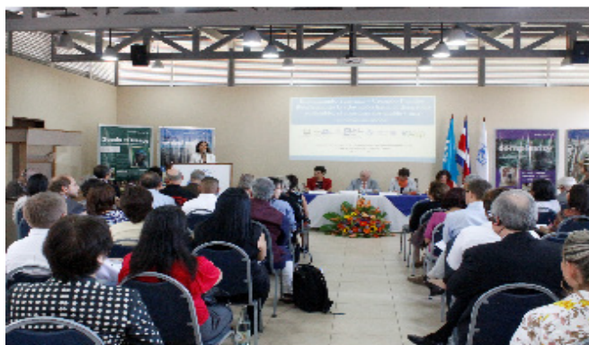
Foro de Educación para el Desarrollo Sostenible, San José, Costa Rica