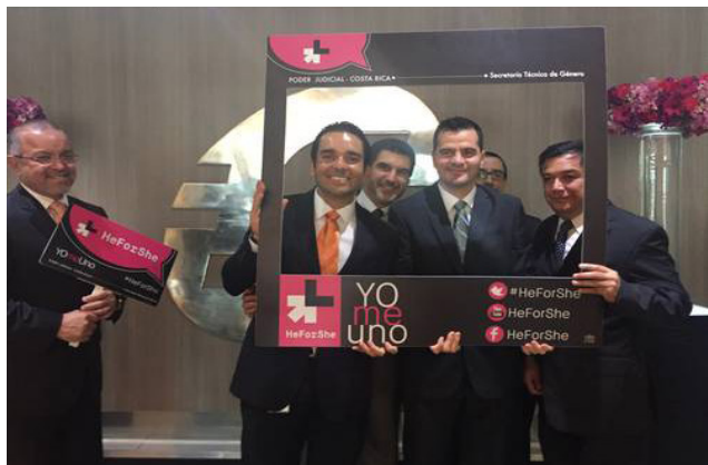
Lanzamiento de la campaña de ONU Mujeres "HeForShe"