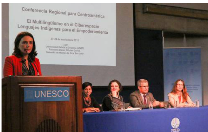
Conferencia Regional de UNESCO sobre Multilingüismo en el Ciberespacio ©UNESCO

Como resultado se elaboró una Hoja de Ruta Regional para la creación del Atlas Regional de Idiomas para Centroamérica, el primero en su clase en el contexto del renombrado Atlas Mundial de la UNESCO. Con el Atlas se pretende crear una ciber-presencia que sea abierta, participativa y equitativa. El objetivo a largo plazo es el de contribuir a la preservación de la diversidad lingüística del mundo y del patrimonio cultural, mediante una plataforma online global interactiva, colaborativa y abierta.