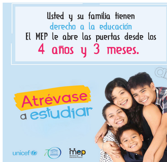
Campaña comunicacional “Yo me Apunto”

La UNESCO, junto con UNICEF, apoyó al MEP en la realización de una campaña de información y comunicación que incentiva el retorno a las aulas, durante los momentos de matrícula para el año escolar 2016.