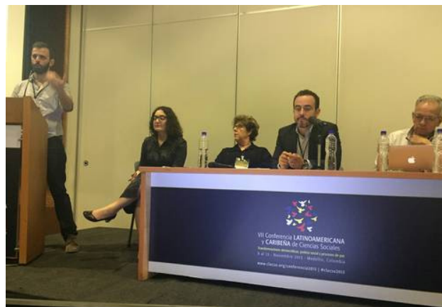
Panel "Abriendo fronteras: transformación social en áreas urbano vulnerables"