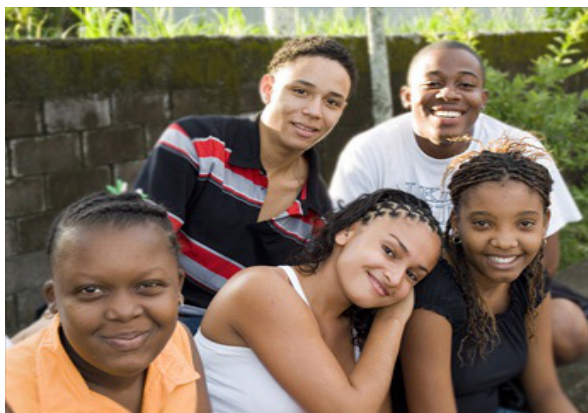
Juventud afrodescendiente de Costa Rica