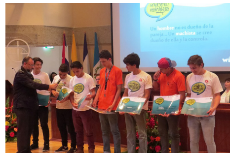
Participantes de la conferencia "Vinculando a los varones con el logro de la igualdad de género"

Esta conferencia también buscó fortalecer capacidades de oficiales del Poder Judicial y otras instituciones y dar la oportunidad a estudiantes universitarios y Organizaciones No Gubernamentales de acceder a personas expertas de alto nivel que trabajan los temas de género.