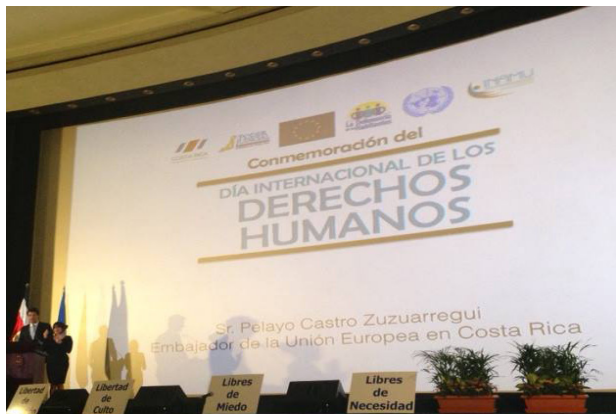
Conmemoración Día Internacional de los Derechos Humanos