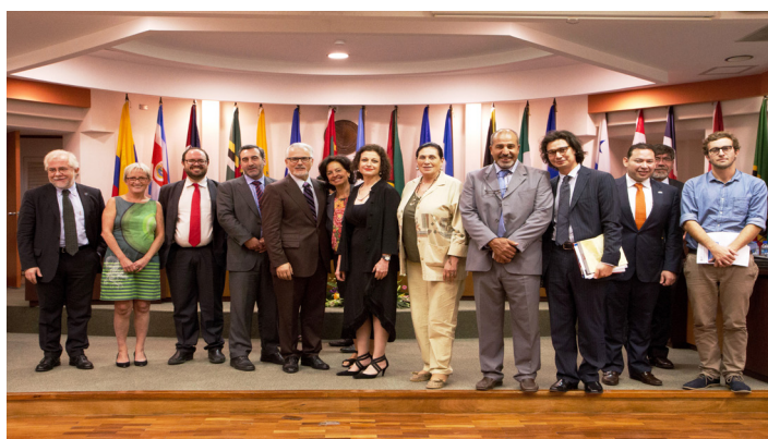
Conferencia Fin a la impunidad en crímenes contra periodistas

El evento ofreció de antemano una reflexión global y regional sobre el Día Internacional contra la Impunidad para Crímenes contra los Periodistas de las Naciones Unidas, celebrado el 2 de noviembre.