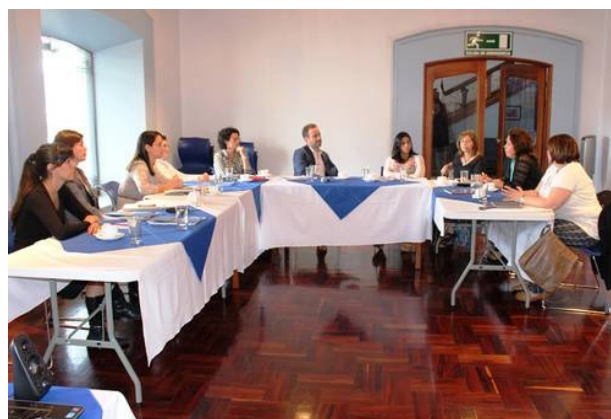
Mesa de trabajo sobre la aplicación de los Indicadores de Género para Medios de Comunicación

La herramienta de GSIM también proporciona información sobre la necesidad de entrenamiento, pues contiene todos los puntos principales sobre el género y los medios de comunicación.