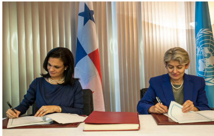
Vicepresidenta de la República y Ministra de Relaciones Exteriores de Panamá, Isabelle de Saint Malo de Alvarado, y la Directora General de la UNESCO, Irina Bokova

En 2001, Panamá fue el primer país en ratificar la Convención de la UNESCO sobre la protección del patrimonio cultural subacuático.