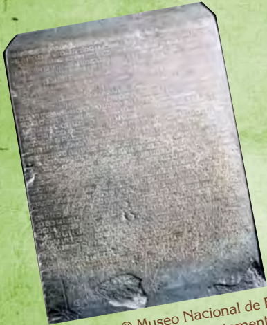
Inscripción del rey Ram Khamhaeng – Segundo lado