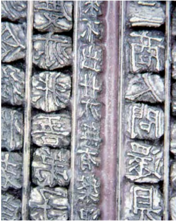
Tipo metálico restaurado de Jikji

antiguo del mundo impreso con tipos móviles metálicos y que forma parte del Registro de la Memoria del Mundo.