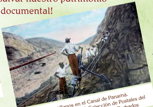
Trabajadores Antillanos en el Canal de Panamá. Preparando una explosión.

Proteger y promover el Conocimiento Global Registrado