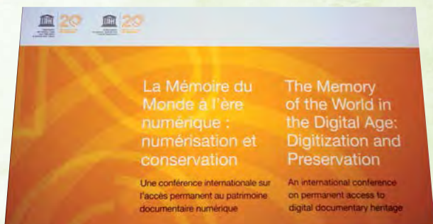
UNESCO/UBC DECLARACIÓN DE VANCOUVER 26 al 28 de septiembre de 2012 Vancouver, Columbia Británica, Canadá

En la actualidad, se pierden constantemente grandes cantidades de información porque se desconoce su importancia, porque no existen marcos legales e institucionales para garantizar su preservación, o porque sus custodios carecen de conocimiento, habilidades o fondos. A fin de analizar en profundidad estas cuestiones y encontrar soluciones, la Directora General de la UNESCO organizó la conferencia internacional “La Memoria del Mundo en la era digital: digitalización y preservación”, celebrada del 26 al 28 de septiembre de 2012 en Vancouver (Columbia Británica, Canadá).