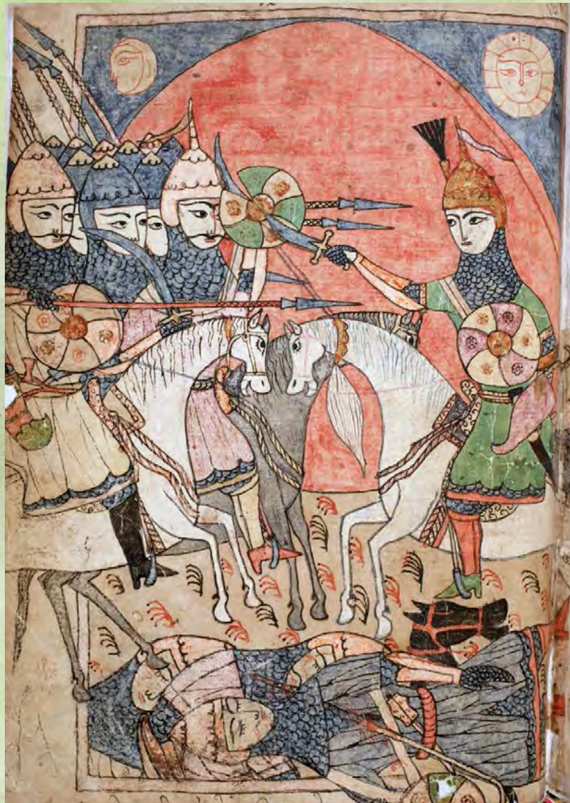
Colección de manuscritos del poema de Shota Rustaveli "El caballero de la piel de pantera"

Place de Fontenoy No. 7 75352 Paris 07 SP Tel. 01 45 68 44 97