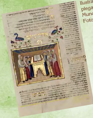
Ilustración incluida al final de un libro de plegarias: El himno Adom Olam (Señor del Mundo). Fol. 274 v. Miscelánea Rothschild