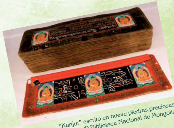
“Kanjur” escrito en nueve piedras preciosas

Además de ser una parte fundamental de la memoria de los pueblos del mundo, el patrimonio documental contenido en archivos, bibliotecas y museos refleja la diversidad de pueblos, lenguas y culturas existentes. Sin embargo, esta memoria es frágil.