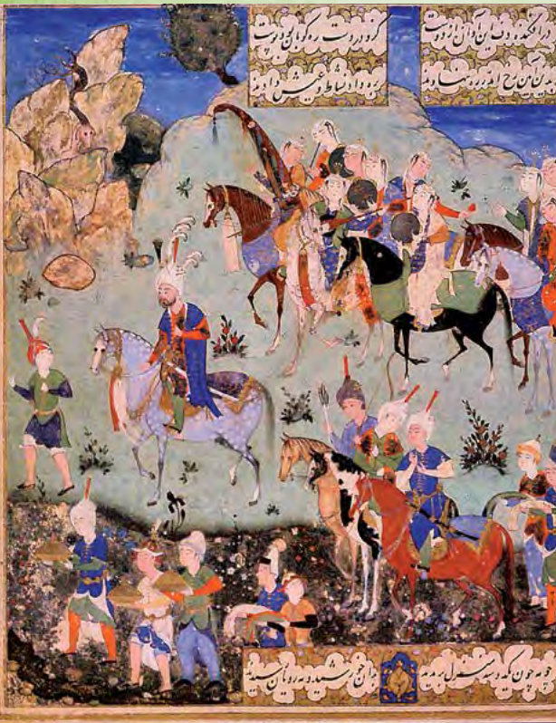
Páginas iniciales con versos iluminados, bordes y ornamentación en los márgenes Fotografía: © Biblioteca Nacional y Archivo de Egipto, Shelfmark Masahif Rasid 14

Con este objetivo, la UNESCO creó en 1992 el Programa Memoria del Mundo.