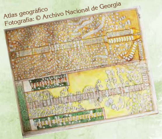
Atlas geográfico

Si en la antigüedad el testimonio del pasado se registraba en la piedra, el papiro, el pergamino y el papel, hoy día la vida pasa por la radio, el cine, la televisión e Internet.