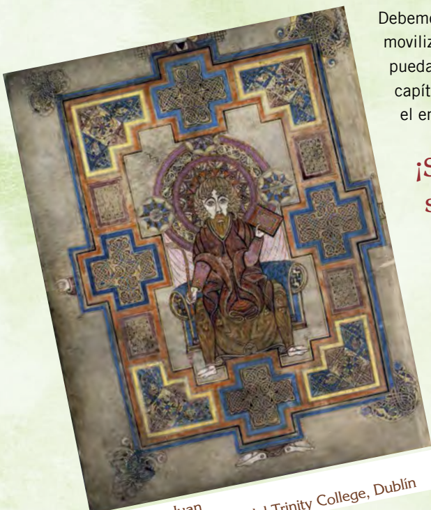
Retrato de Juan

¡Sólo la acción colectiva puede salvar nuestro patrimonio documental!