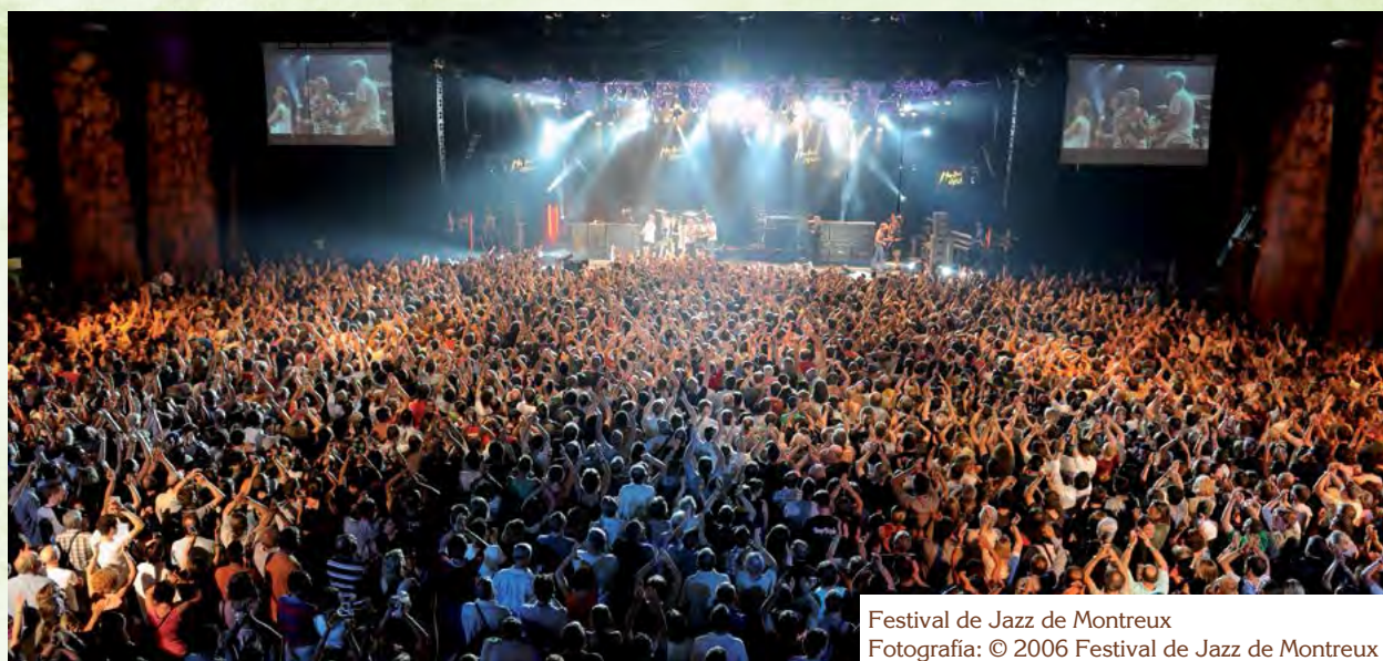
Festival de Jazz de Montreux