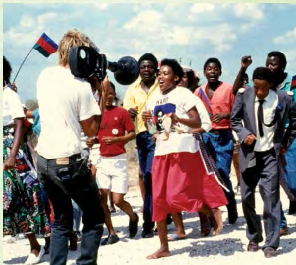
Acto político para el partido SWAPO, Namibia