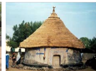
La case sacrée de Kangaba

! ATTENTION, CERTAINES EXPRESSIONS CULTURELLES ET CERTAINS LIEUX COMMUNAUTAIRES EXIGENT UNE CONDUITE QUI N'EST PAS LA MÊME QUE CHEZ VOUS.