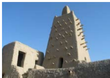
Mosquée de Djingareyber, Tombouctou