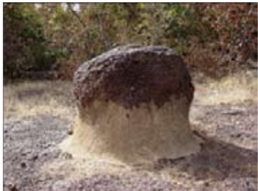
Site de proclamation de la Charte du Manden