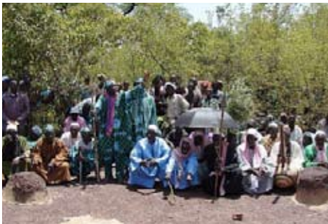
Site de proclamation de la Charte du Manden