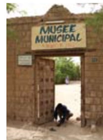
Musée municipal, Tombouctou