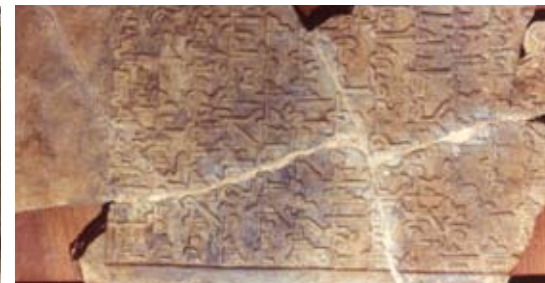
Stèle funéraire