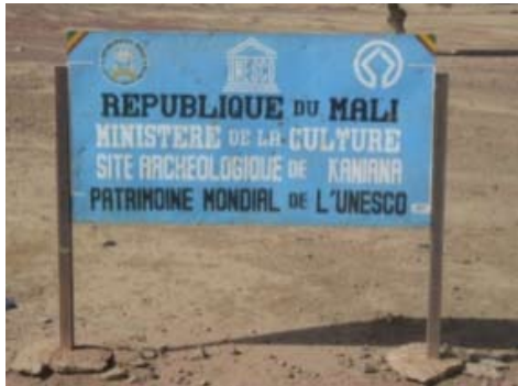
Site archéologique de Tonomba

Faites attention aux signes indiquant un site culturel : barrières, panneaux, plaques commémoratives, emblèmes, etc. Mais certains sites ne comportent pas de telles indications.