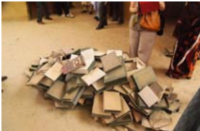
Centre Ahmed Baba, Tombouctou