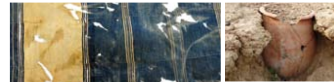
Tissu tellem