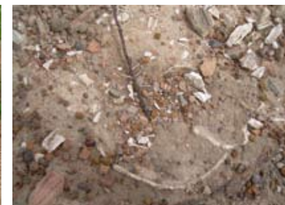
Site archéologique de Djenné-Djeno