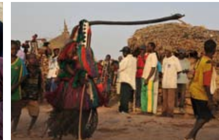
Bankass, danse des masques