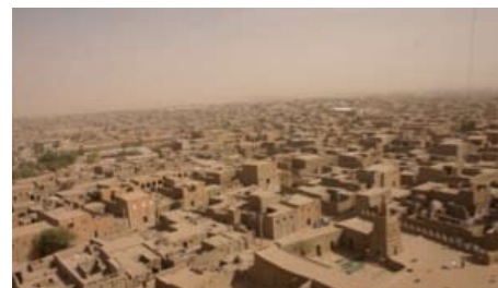
Vue aérienne de Tombouctou