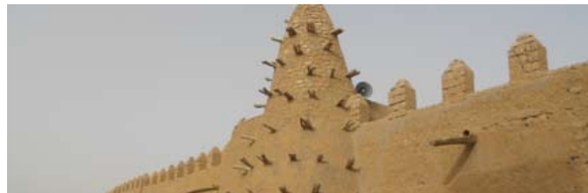
Mosquée de Djingareyber, Tombouctou

Une mission qui fait partie du mandat de la MINUSMA (Mission multidimensionnelle intégrée des Nations Unies au Mali), créée en avril 2013 par le Conseil de sécurité des Nations Unies (Résolution n° 2100)