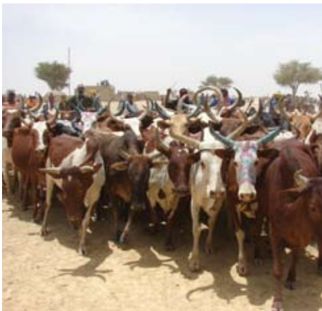
Yaaral dégal