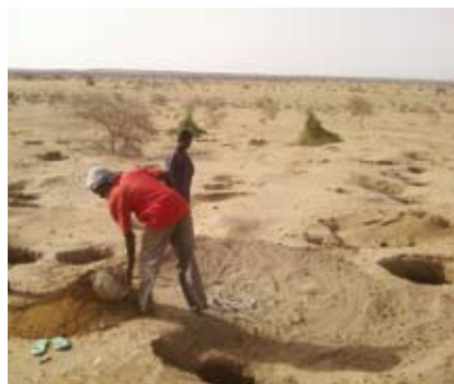
Site archéologique de Gao-Saneye