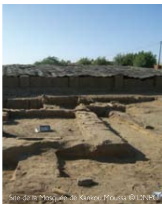
Site de la Mosquée de Kankou Moussa

Ces deux derniers ont été placés sur la Liste du patrimoine mondial en péril en 2012.