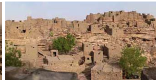
Falaises de Bandiagara