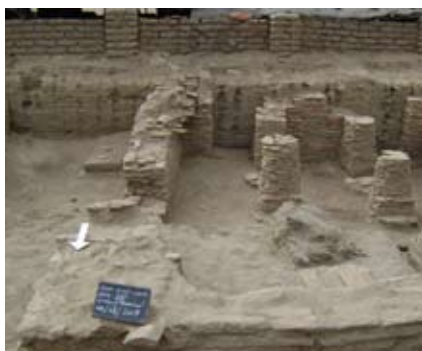
Site archéologique de Kankou Moussa