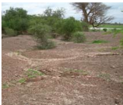
Site archéologique de Djenné-Djeno