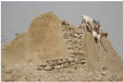
Mausolée Alpha Moya, Tombouctou