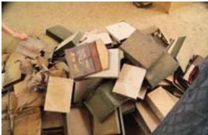
Centre Ahmed Baba, Tombouctou