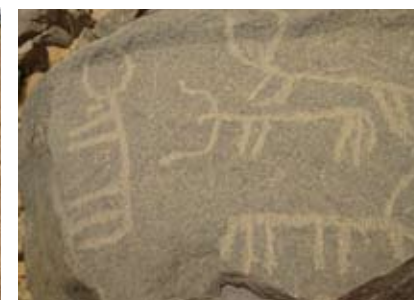
Gravures rupestres