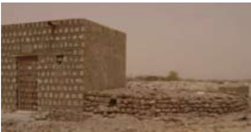
Mausolée Cheikh Sidi Aboukhassoum, cimetière des trois saints