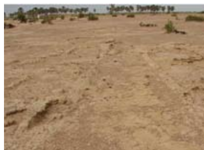
Site archéologique de Dia