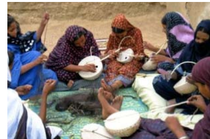
Fabrication d'instruments de musique