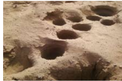
Site archéologique Gao-Saneyé