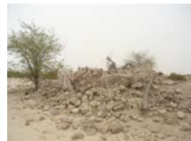
Mausolée Ben Amar détruit, Tombouctou

Pendant votre mission, vous devez impérativement éviter de :