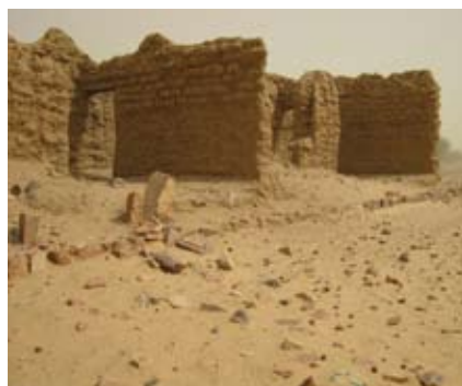
Site archéologique d'Es-Souk