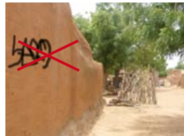
Mur avec graffiti