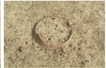
Jarre funéraire