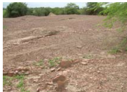
Site archéologique de Djenné-Djeno