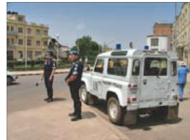
Check point