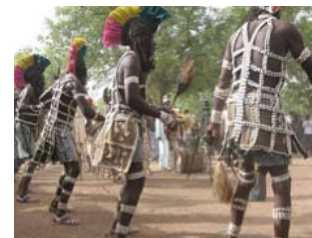
Sanké Mon