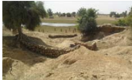
Site archéologique de Djenné-Djeno