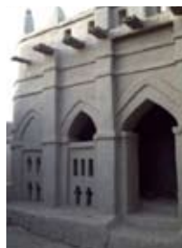
Maison Saho, Djenné