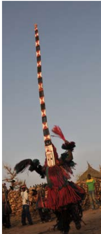
Cérémonie de masques, pays dogon