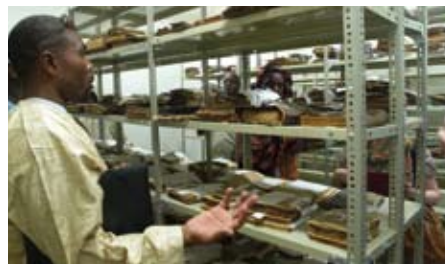
Centre Ahmed Baba, Tombouctou