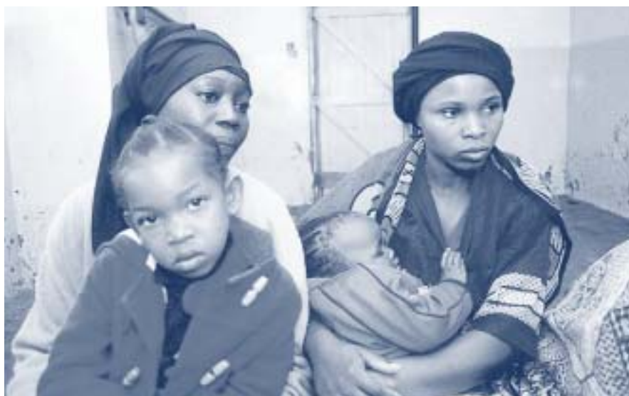
Насилие против молодых женщин является частью повседневной жизни в Кении

Проект разрывает порочный круг, в котором оказываются молодые женщины, живущие в трущобах Кении