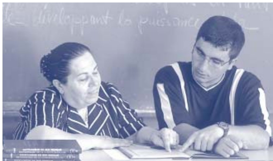
El programa UNILIT representa un puente entre los privilegiados jóvenes universitarios y las comunidades pobres.

Contactos: Ramzi Salamé, o Nour Dajani, UNESCO Beirut; e – mail: r.salame@unesco.org o n.dajani@unesco.org