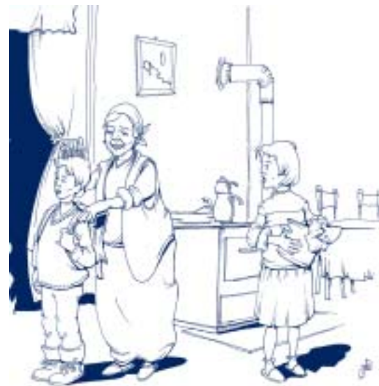
del libro de texto utilizado en el programa de alfabetización de Kosovo.

Contactos: U. Hanemann y M. Elfert, IEU, Hamburgo; e mail: u.haneman@unesco.org y m.elfert@memo.unesco.org