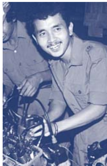
Nuevo intento por reconocer las destrezas de personas sin calificaciones formales.

Contact: Mohan Perera, UNESCO París e-mail: m.perera@unesco.org