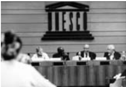
Lancement du dialogue philosophique interrégional entre l'Asie et le monde arabe. Siège de l'UNESCO, Paris 16 et 17 novembre 2004.

En conformité avec la vocation de la Stratégie intersectorielle concernant la philosophie, les dialogues philosophiques interrégionaux seront poursuivis entre d'autres régions du monde, de façon alternative et seront mis en œuvre avec toujours la même exigence : celle de créer des liens entre les philosophes, là où ils n'existent pas et de renforcer ceux qui existent.