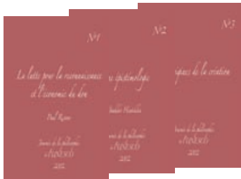
Actes de la Journée mondiale de la philosophie, 21 novembre 2002 Série de 11 livrets (2004)