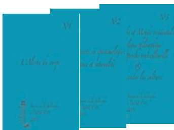
Actes de la Journée mondiale de la philosophie, 20 novembre 2003 Série de 7 livrets (2005)