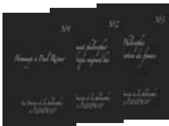
Actes de la Journée mondiale de la philosophie, 18 novembre 2004 Série de 10 livrets (2006)

La diffusion de la philosophie dans le grand public est essentielle au développement d'une culture démocratique et pacifique. L'indépendance de la pensée qui apporte le savoir engendré par la philosophie est un facteur crucial de paix, notamment dans les pays où la philosophie n'est pas encore officiellement enseignée. L'accent sera mis en particulier sur la traduction d'œuvres philosophiques.