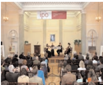
XIII e édition des Olympiades Internationales de philosophie (IPO) Varsovie (Pologne, 19 – 23 mai 2005)