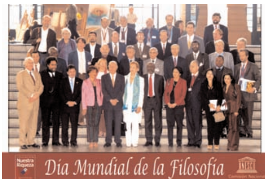
Ouverture de la Journée mondiale de la philosophie à Santiago du Chili (Chili), le 24 Novembre 2005, en présence de Monsieur Ricardo Lagos Escobar, Président de la République chilienne

4 - Demande à l'Assemblée générale des Nations Unies de s'associer à cette célébration et d'encourager tous les États membres de l'ONU à le faire.