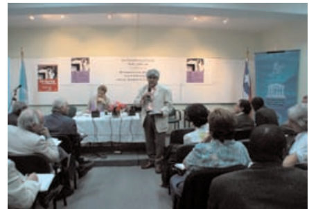
Lancement du dialogue philosophique interrégional entre l'Afrique et l'Amérique latine. Bureau de l'UNESCO de Santiago (Chili) 24 novembre 2005.