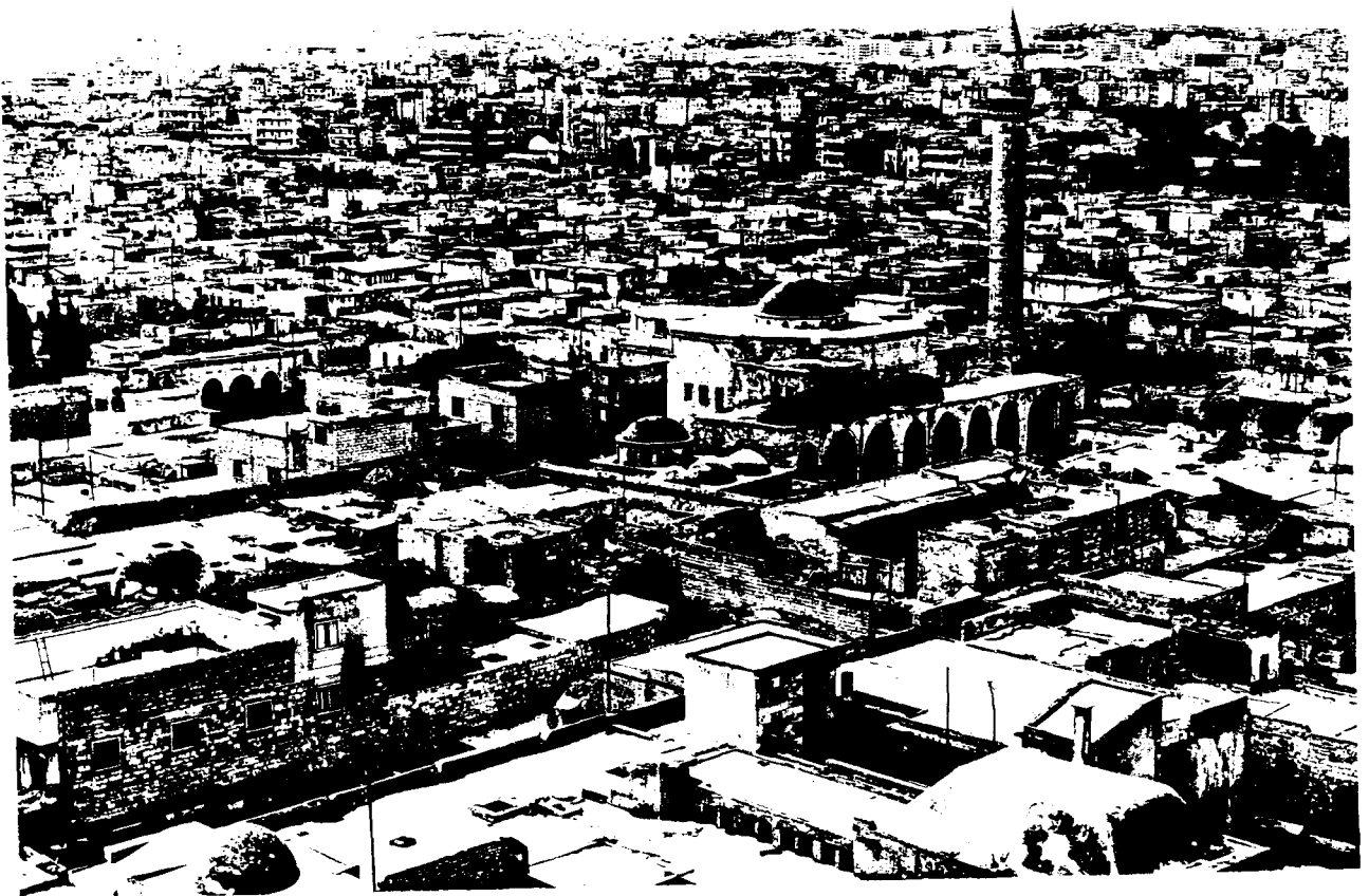
CENTRE HISTORIQUE D' ALEP