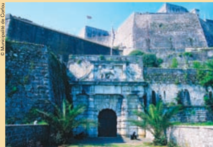
La vieja muralla junto al puerto.

Por otro lado, la Ciudad Vieja de Corfú, con su laberinto de callejuelas vivaces intramuros, actualmente también forma parte del sitio del Patrimonio Mundial. Caracterizada por una arquitectura de estilo italiano, ostenta varias iglesias ortodoxas orientales (una de ellas contiene los restos momificados de San Spiridion) mientras que su amplia explanada incorpora un campo de críquet muy británico. Corfú posee una identidad única por su estructura y su forma, su estilo de vida, sus manifestaciones artísticas y su literatura, por haber asimilado por ósmosis tanto las peculiaridades de Oriente como de Occidente. Este conjunto se ha conservado casi enteramente intacto hasta nuestros días, y el reconocimiento del Centro del Patrimonio Mundial le ayudará a cobrar ímpetu