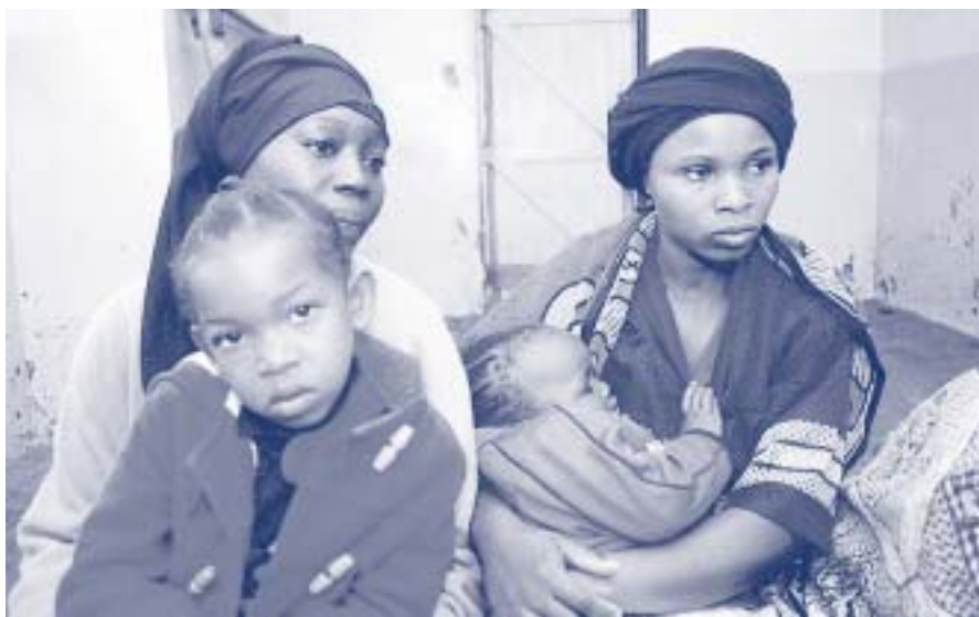
La violencia contra las jóvenes forma parte de la vida cotidiana de Kenya.

Un proyecto está destruyendo el círculo vicioso que afecta a mujeres jóvenes de las barriadas de Kenya