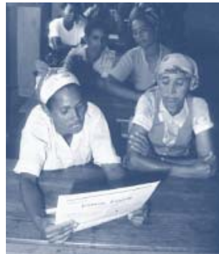
Впервые большинство африканских женщин теперь грамотны.

Новые данные были оглашены в Международный день грамотности, который отмечался во