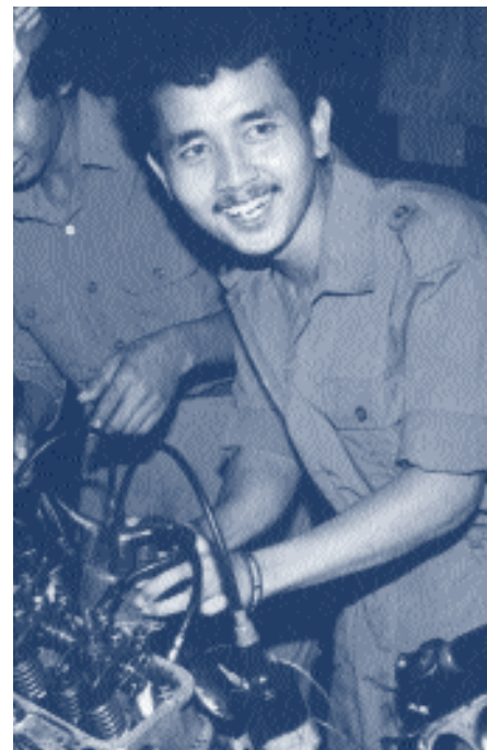
Новый шаг на пути к признанию профессиональных навыков людей, не имеющих официальных сертификатов

Контакты: Мохан Перера, ЮНЕСКО - Париж E-mail: m.perera@unesco.org