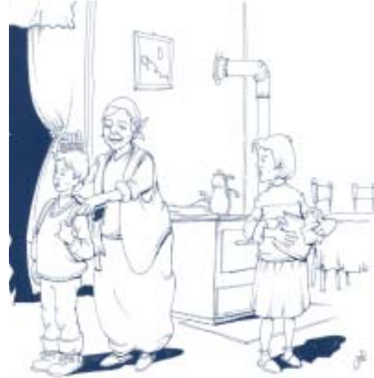
Из учебника, выпущенного по программе развития грамотности в Косово

Контакты: У. Ханеманн и М. Элферт, Институт образования ЮНЕСКО, Гамбург; e-mail: u.hanemann@unesco.org и m.efert@memo.unesco.org.