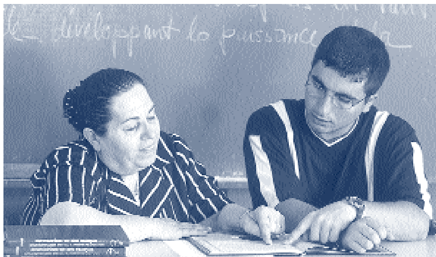
Программа ЮНИЛИТ – мост, соединяющий привилегированную молодежь с бедными слоями общества

Контакты: Хаким А. Хаким, ЮНЕСКО, Бангкок e-mail: a.hakeem@unesco-proap.org