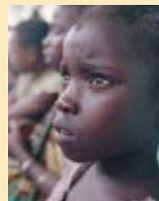
Коки на улице Момбасы, Кения