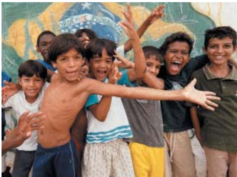
Воскресная школа спасает детей от беды.