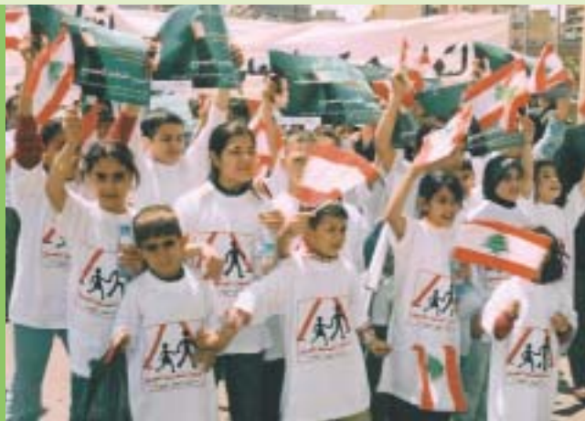
Ливанские дети на пути в парламент.

Более миллиона людей в 110 странах мира участвовали в Большом Лобби – кампании Недели ОДВ по привлечению внимания к проблеме более чем 100 миллионов детей, которым отказано в праве на образование.