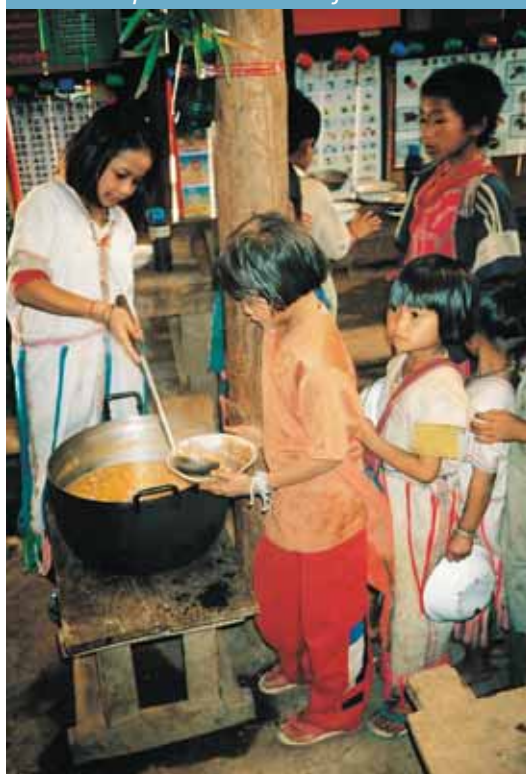
Los centros promueven una mejor nutrición.

Los centros han recibido financiamiento de la cadena de supermercados franceses Carrefour por un monto cercano a los 420.000 dólares y de la UNESCO por 50.000 dólares para el periodo 2001-2004. La UNESCO contempla aportar 50.000 dólares adicionales cuando el financiamiento de Carrefour haya llegado a su fin, el año 2005. Es necesario persistir en los esfuerzos ya que se está evidenciando progreso, aunque éste es muy lento.