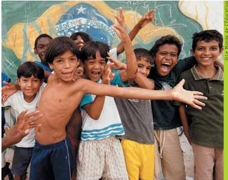
Las escuelas de fines de semana ayudan a los niños a no involucrarse en problemas.