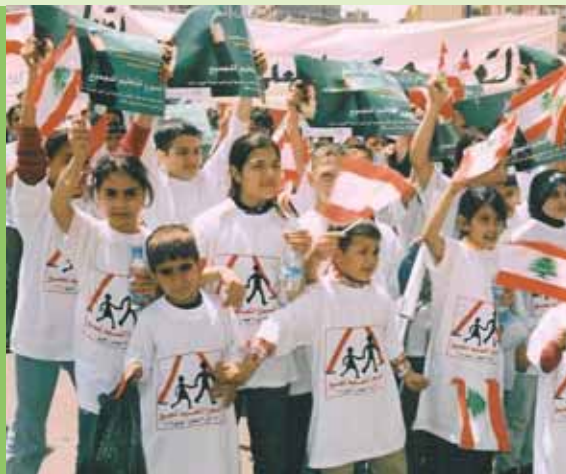
Niños libaneses se dirigen al Parlamento para participar en un lobby.

Más de 1 millón de personas provenientes de 110 países participaron en el Gran Lobby, tema de la campaña de la Semana EPT de este año, orientado a sensibilizar a la opinión pública sobre los más de 100 millones de niños marginados de la educación.