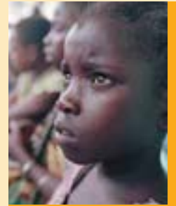
Koki en las calles de Mombasa, Kenya

tunidad de enviar a sus hijos a la escuela en lugar de ponerlos a trabajar.