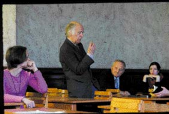
«Круглый стол» в Латвии