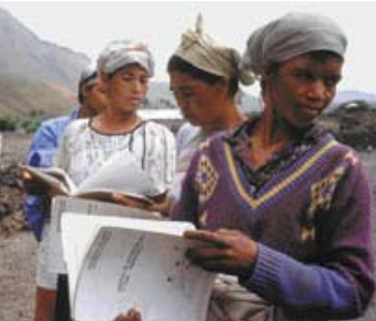
Образование женщин и повышение их роли в развитии общества являются одними из приоритетов для Африки

проектов, относящихся к гуманитарной безопасности в Африке.