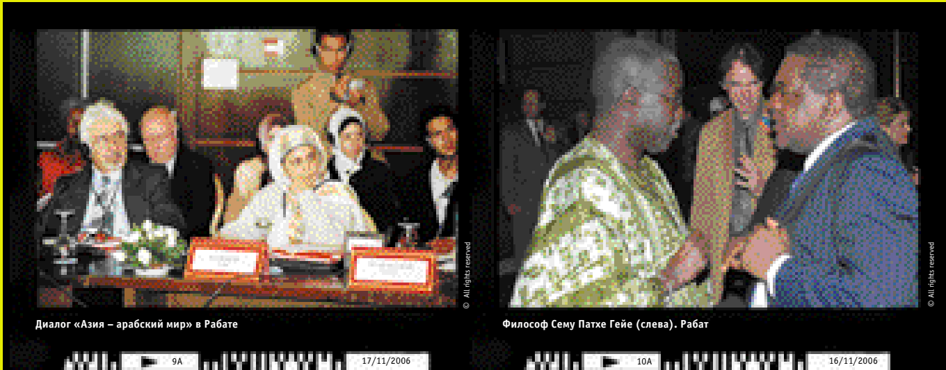
Диалог «Азия – арабский мир» в Рабате