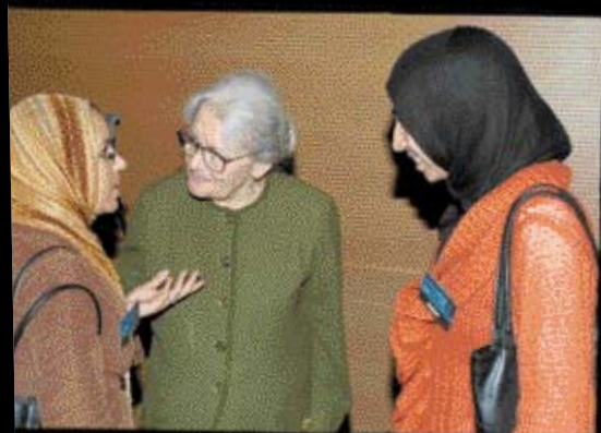
Неформальные дискуссии в Рабате