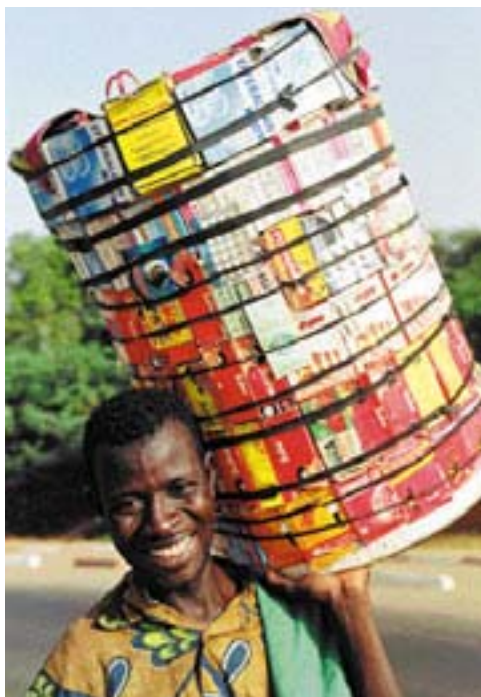
«Знахарь» – торговец лекарствами на улицах Ниамея (Нигер)

Более 50 глав государств и правительств приняли Аддис-Абебскую декларацию, в которой выразили свою готовность «обеспечивать тщательное применение принципов научной этики в Африке с целью сохранения окружающей среды и природных ресурсов континента и предотвращения любой деятельности, наносящей вред населению Африки».