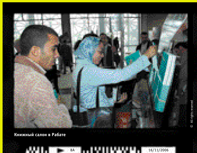
Книжный салон в Рабате

Мне бы также хотелось особо подчеркнуть связь между философией, демократией и миром. Философия может и должна помогать нам осмысливать актуальные проблемы. И мне кажется, что ЮНЕСКО имеет все возможности работать вместе с