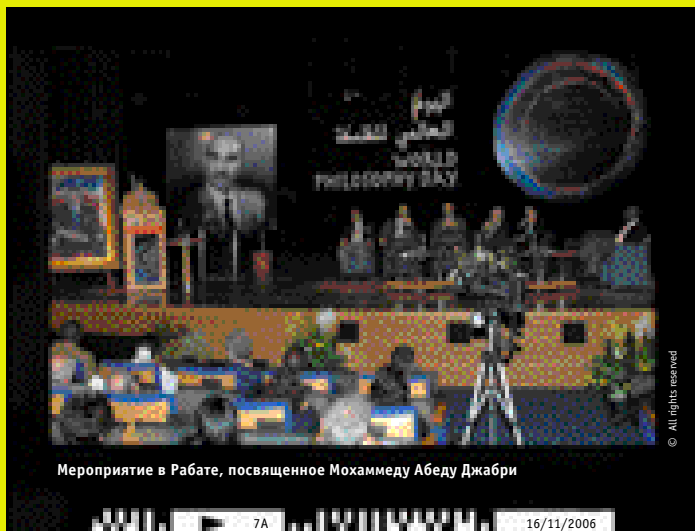
Мероприятие в Рабате, посвященное Мохаммеду Абеду Джабри

Я всегда выступала за создание сетей, объединяющих преданных своему делу людей, борющихся за равенство, мир, просвещение в духе мира и толерантное отношение к другим во всех регионах мира. На мой взгляд, именно такой процесс отражает глубину человеческой природы и именно он должен определять все процедуры и решения ЮНЕСКО при осуществлении ею своих проектов и мероприятий. Если такая сеть будет создана, тогда я искренне надеюсь, что она не превратится в обычную структуру, в рамках которой женщины-философы буду заниматься только выражением своих чисто личных проблем. Философия не имеет пола! Вот почему следует поощрять любую инициативу, направленную на активное вовлечение женщин-философов из всех стран – наравне, конечно, →