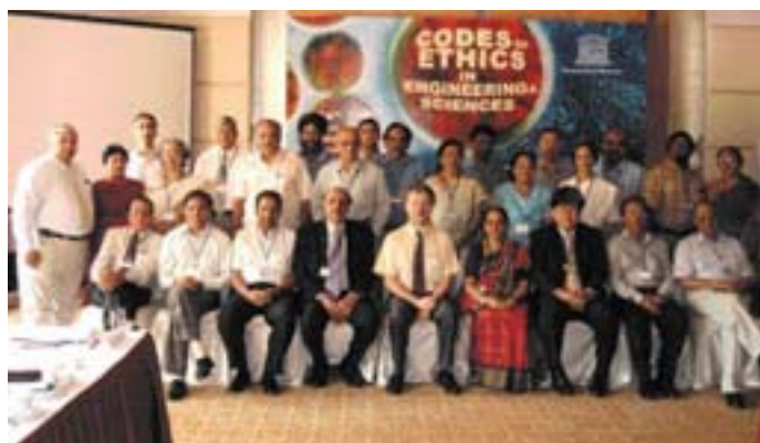
В течение двух лет Бюро ЮНЕСКО в Бангкоке расширяет число совещаний, проводимых в регионе. На фото участники Консультаций по этическим кодексам, проходивших в 2006 г. в Индии

За более подробной информацией обращайтесь: Дэррил Мейсер (Darryl Macer), d.macer@unesco.org, тел.: + 662 391 0577, Bangkok Office website: www.unescobbkk.org