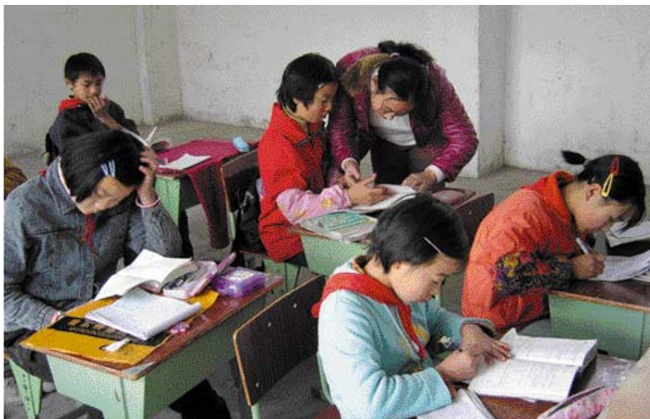
Проект ЮНЕСКО стремится укрепить у детей-мигрантов уверенность в своих силах и чувство собственного достоинства

Среди тем, обсуждавшихся на совещании политиками, руководителями, учеными и преподавателями, были также результаты админист-