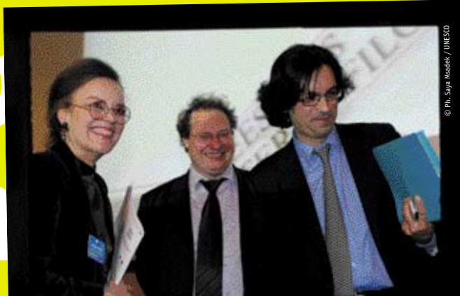
Штаб-квартира ЮНЕСКО. Конференция по Левинасу