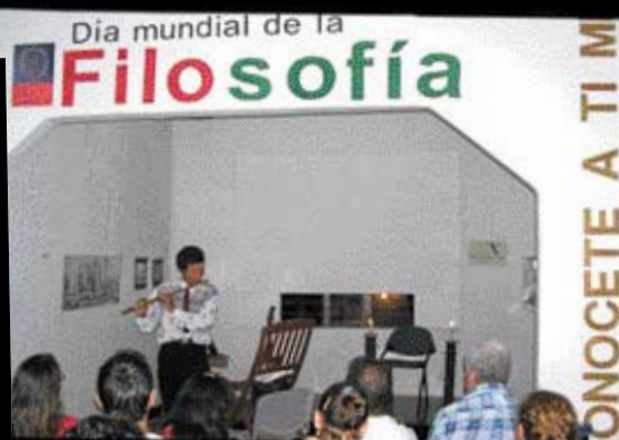
Концерт в честь Дня философии в Колумбии