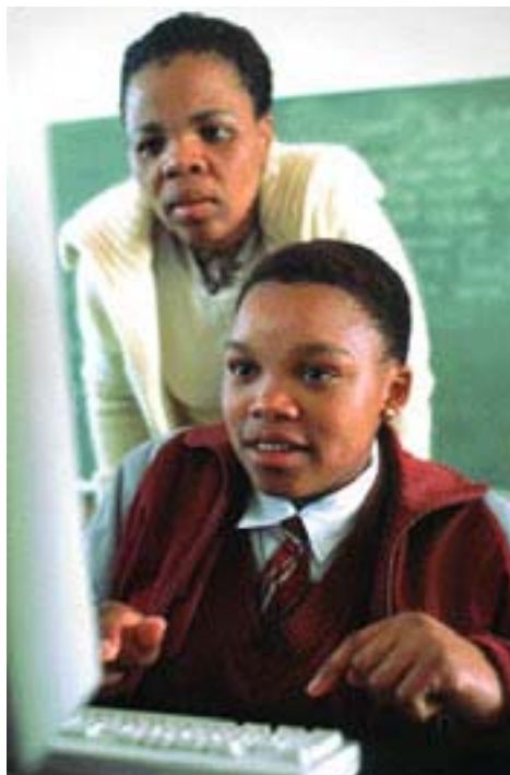
Отсутствие возможностей для работы и дальнейшего роста вынуждает все большее число молодых африканцев покидать свою страну

Из сказанного следует, что при решении миграционных проблем необходимо поставить под вопрос логику ужесточения мер пограничного контроля: они не останавливают постоянные потоки мигрантов, а лишь заставляют их идти на все большие риски. Ответ на феномен африканской миграции лежит в срочном переосмыслении развития и политики сотрудничества между Севером и Югом. ¶