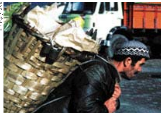
ЮНЕСКО хочет помочь государствам-членам создать более гуманные структуры сокращения масштабов нищеты

Первое заседание рабочей группы при участии двух независимых экспертов из УВКПЧ планируется на 19–20 марта 2007 г. Его цель – определить уровень минимальных стандартов, снижение которых ставит под угрозу соблюдение прав человека. В дальнейшем такие стандарты могли бы использоваться правительствами как гаранты соблюдения прав человека в их странах, а также при переговорах с финансирующими агентствами.