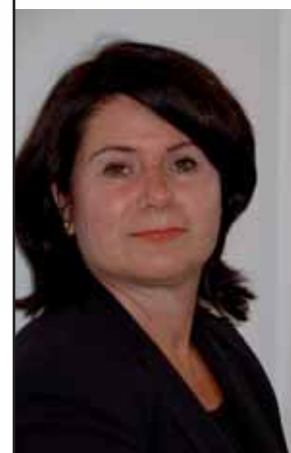
escrito por Karina Veal 1

A pesar del mayor interés internacional en el campo del TVET en las sociedades postconflicto, entre practicantes y académicos, la mayor parte de la literatura disponible en este nuevo campo es "gris" pues sólo existen informes y estudios de casos no-indexados, con frecuencia efímeros. Los folletos superan a los libros. Hay manuales, pautas y guías de "cómo hacer", publicados por agencias internacionales que operan en el campo (ILO, UNHCR y UNESCO) y un pocas publicaciones en el tema de la educación en situaciones post-emergencia. Sin embargo, varios investigadores han escrito casos de estudio de TVET en diversos escenarios post-