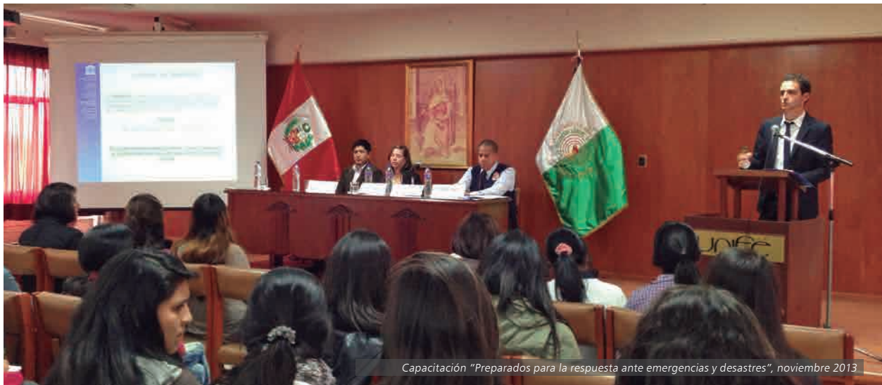
Capacitación “Preparados para la respuesta ante emergencias y desastres”, noviembre 2013

En el marco del Día Mundial de la Libertad de Prensa, periodistas y comunicadores sociales fueron sensibilizados sobre la importancia de la autorregulación y ética profesional, mediante su participación en el foro “Libertad de Prensa, Ética y Autorregulación”.