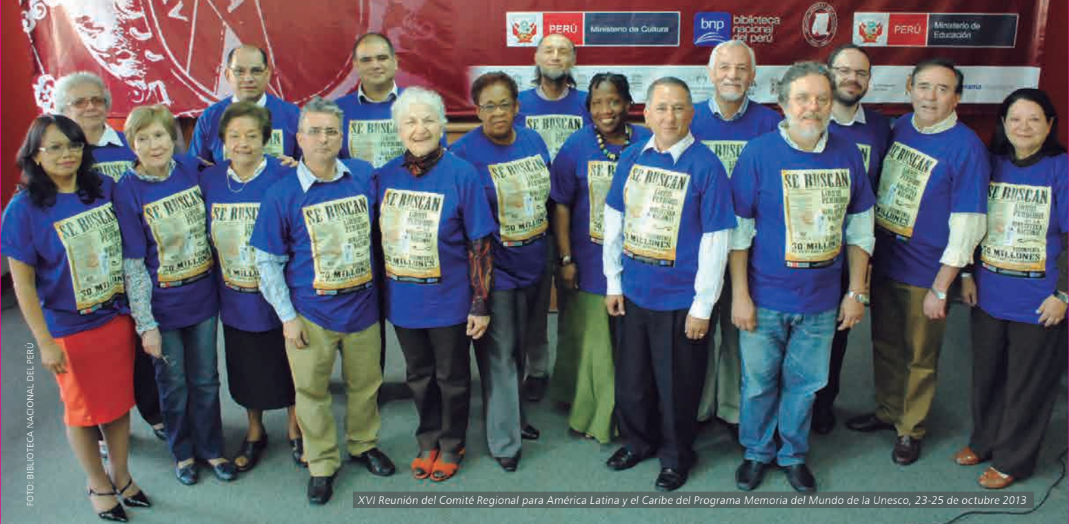
XVI Reunión del Comité Regional para América Latina y el Caribe del Programa Memoria del Mundo de la Unesco, 23-25 de octubre 2013

En el ámbito de la reunión, la UNESCO hizo entrega al Ministerio de Cultura de los certificados del Programa Memoria del Mundo que acreditan como joyas del Patrimonio Documental Mundial a los libros: “Protocolo Ambulante de los Conquistadores o Libro Becerro” y “Los Incunables Peruanos” (1584-1619).