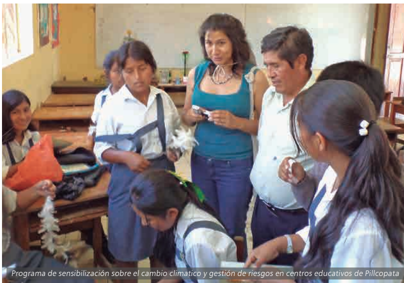
Programa de sensibilización sobre el cambio climático y gestión de riesgos en centros educativos de Pillcopata