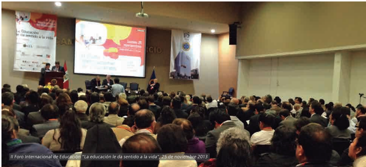
II Foro Internacional de Educación "La educación le da sentido a la vida", 25 de noviembre 2013

UNESCO reiteró la importancia de la Educación para el Desarrollo Sostenible, cuyo fin es la formación de personas críticas, íntegras, exitosas y hábiles, mediante el patrocinio del Segundo Foro Internacional de Educación "La educación le da sentido a la vida".