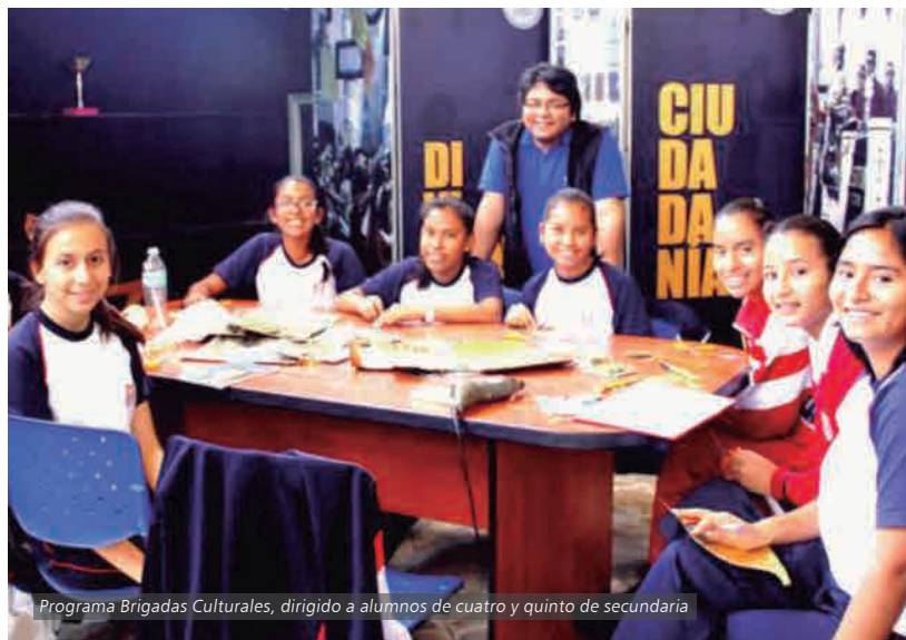
Programa Brigadas Culturales, dirigido a alumnos de cuarto y quinto de secundaria