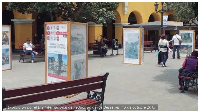
Exposición por el Día Internacional de Reducción de los Desastres, 13 de octubre 2013

elaboración de cursos relacionados con el tema.