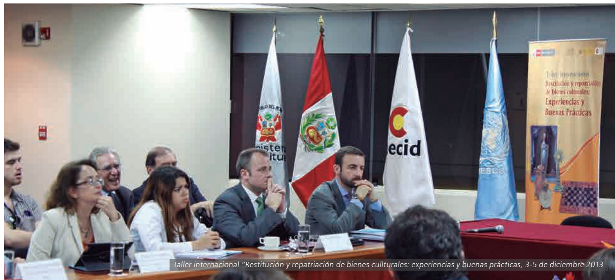
Taller internacional "Restitución y repatriación de bienes culturales: experiencias y buenas prácticas, 3-5 de diciembre 2013