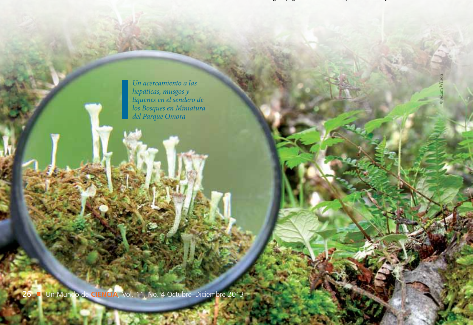
Un acercamiento a las hepáticas, musgos y líquenes en el sendero de los Bosques en Miniatura del Parque Omora

El Parque Omora tiene un programa de monitoreo de aves a largo plazo. Los científicos estudian los patrones de migración y ecología de las aves en un programa que también registra el conocimiento ornitológico yagán. También han ayudado a los operadores turísticos