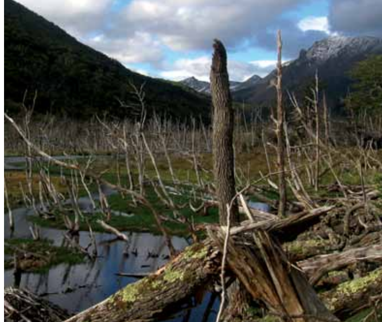
A la izquierda, un niño acaricia a su castor mascota y a la derecha la vista menos agradable del efecto de esta especie invasora: un valle en la isla Navarino después de la “ingeniería de ecosistemas” de una pareja de castores.

Magallanes, el comité también incluye al Gobierno de la Provincia Antártica Chilena, la Municipalidad de Cabo de Hornos y la Armada de Chile. El comité científico presidido por el Parque Etnobotánico Omora cumple una función de asesoría, pero no tiene derecho a voto. La estrategia de Parque Omora es combinar investigación científica interdisciplinaria con programas educativos y promoción del turismo sostenible. Los investigadores y estudiantes de posgrado del centro también colaboran con el Servicio Agrícola y Ganadero y el Gobierno Regional en un programa para controlar especies invasivas, entre ellas el visón ( Neovison vison ), los cerdos salvajes y perros. En el 2008, el Parque Omora colaboró con el Gobierno Regional en un estudio sobre la viabilidad de la erradicación de los 100 000 castores de la reserva de