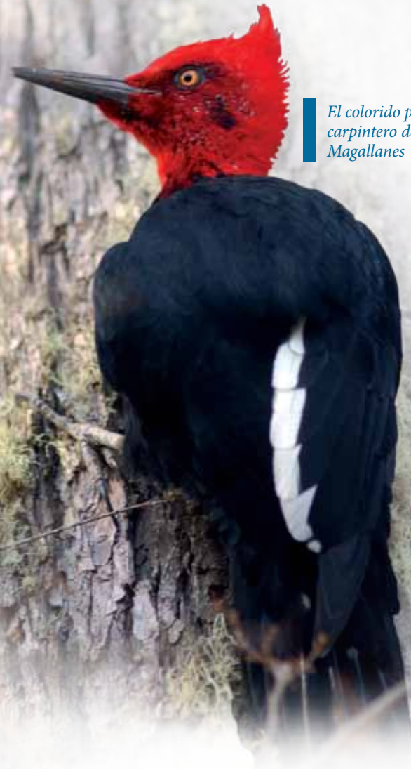
El colorido pájaro carpintero de Magallanes

El equipo de investigadores del Parque Etnobotánico Omora en la isla Navarino ha inventariado más especies de musgos (450) y hepáticas (368) en la reserva de la biosfera que especies de plantas vasculares (773), identificando a la región como un hotspot para la brioflora. En la mayoría de las regiones del mundo, hay cerca de 20 veces más plantas vasculares que briofitas, debido a que las especies de plantas vasculares son mucho más comunes (300 000) que las especies de briofitas (15 000).