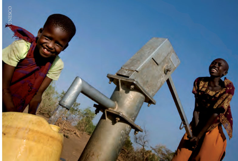
Le camp de réfugiés de Kakuma, dans le district de Turkana (Kenya), qui dispose désormais d'un accès durable à l'eau, grâce à un projet de l'UNESCO qui a permis de déterminer où creuser des puits. On en creuse actuellement un peu partout dans cette région frappée par la sécheresse.

Il semble difficile de réglementer le pompage des eaux souterraines. En effet, l'accès aux eaux souterraines est perçu comme une affaire essentiellement privée, même si la plupart des juridictions définissent l'eau comme un bien « public ». Les utilisateurs constituent cependant un groupe identifiable : toutes les personnes qui ont accès à une pompe. Si vous ajoutez à ce groupe ceux qui répandent des engrais ou des pesticides chimiques, qui extraient du pétrole, du gaz ou des minéraux, qui éliminent des déchets non traités ou dangereux (nucléaires, chimiques, etc.) ou qui construisent sous terre (tunnels, réseaux de transport et d'assainissement,