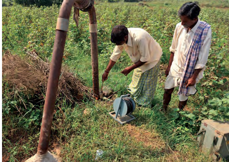
Des agriculteurs du plateau du Deccan mesurent le niveau des précipitations à l'aide de l'un des 190 pluviomètres, dans le cadre d'un projet de la FAO qui leur apprend à gérer de manière durable leurs ressources limitées en eau douce.

Pour gérer efficacement un aquifère, il faut des données et des informations fiables. Malheureusement, il y a dix ans, les connaissances en matière