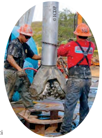
■ Installation de forage

Les auteurs du document thématique préconisent que les pays disposant d'une législation ou de moyens répressifs inadéquats renvoient leurs accords de licence sur le pétrole et le gaz, afin de s'assurer que ceux-ci prévoient des indemnités conséquentes internationalement reconnues pour couvrir toute dégradation éventuelle des ressources ou de l'environnement. Comme les compagnies pétrolières et gazières vont s'opposer à une telle mesure, les auteurs suggèrent que l'OMC, ou un autre organe compétent de l'ONU, conçoive et mette en oeuvre cette couverture d'assurance au nom des pays exportateurs de pétrole et de gaz.