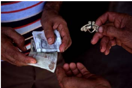
Individu achetant une pièce précolombienne