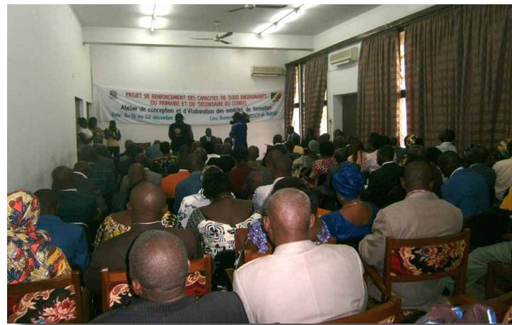
Une vue de l'assistance

communs devant orienter le processus d'élaboration des modules et de mise en œuvre des formations. Au moment où le Congo Brazzaville s'est engagé dans un processus de formation de 3000 enseignants du primaire et du secondaire, cet atelier a permis un renforcement des capacités pour une meilleure identification et formulation des éléments techniques susceptibles de compléter les modules de formation existants, étape préalable de ce processus. Les enseignements reçus devraient ensuite permettre aux différentes équipes de rédaction, une fois le processus de rédaction engagé, de consolider, finaliser et d'harmoniser les modules élaborés.