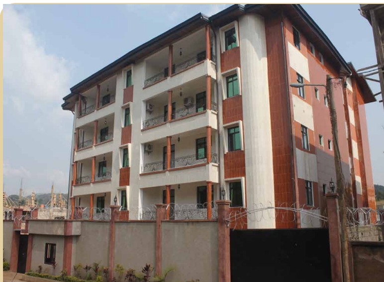
Les nouveaux locaux du Bureau régional de l'UNESCO à Yaoundé et de l'ONUSIDA