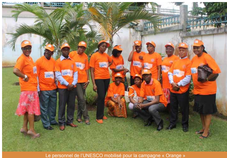
Le personnel de l'UNESCO mobilisé pour la campagne « Orange »