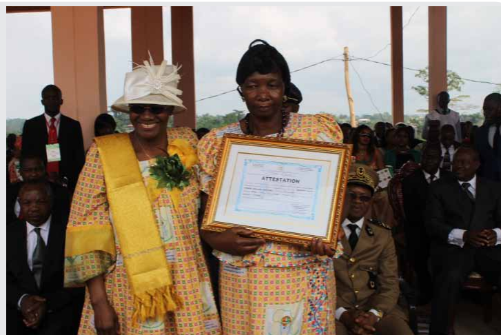
La représentante spéciale de la première dame du Cameroun et une femme initiée en TIC

La solennité de ce 6 décembre vient en effet boucler une vaste série de sessions de formation des femmes qui a duré 10 ans, et qui a permis d'initier 103 500 femmes issues de 77 villes du Cameroun, urbaines et rurales, à l'usage de l'outil informatique. En réalisant cette importante opération dira le Représentant de l'UNESCO, l'IAI «apporte ainsi une contribution considérable aux efforts du Cameroun et des États de la sous-région, de réduire la fracture numérique entre les hommes et les femmes, mais aussi, de renforcer l'autonomisation des femmes en vues d'un développement durable et soutenu.» Il faut dire que les technologies de l'information et de la communication (TIC) ont le potentiel de sensiblement améliorer les vies des femmes, ainsi que