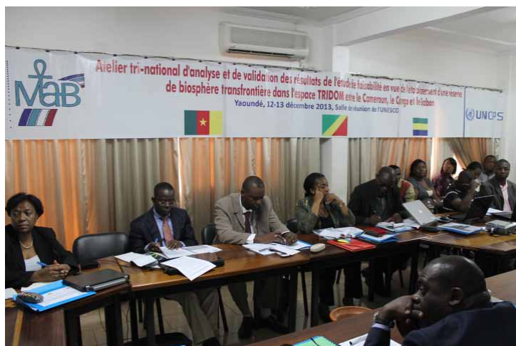
Les participants en plein travaux