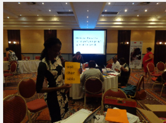
Toolkit development / L'élaboration d'un referential