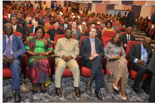
CFIT launch in DR Congo / Le lancement en RD Congo