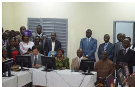
The launch at Daoukro / Le lancement à Daoukro