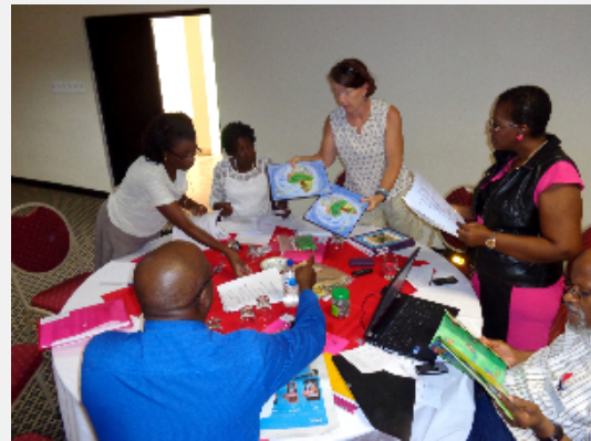
Toolkit development workshop at Windhoek / Atelier d'élaboration d'un référentiel à Windhoek