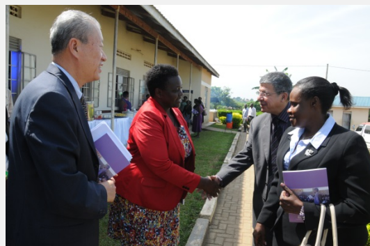
CFIT launch in Uganda / Le lancement en Ouganda