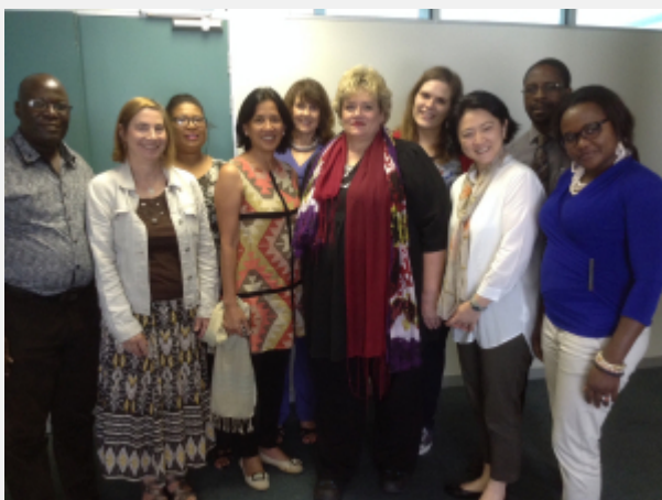
Review mission in Namibia / Mission de suivi en Namibie

The mission on 17-19 March 2015 observed the eagerness of the Ministry of Education and the University of Namibia towards the CFIT Namibia project. Success has been achieved in motivating teacher educators and teachers to reflect their teaching practices in pre- and lower-primary, as well as creating toolkits to improve their practices. The Chinese Embassy also showed their full support and commitment.