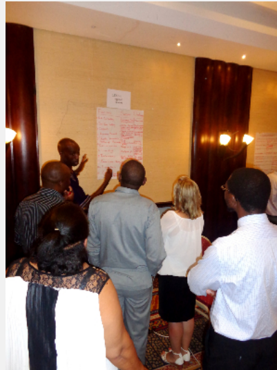
The national platform at Windhoek / La plate-forme nationale à Windhoek