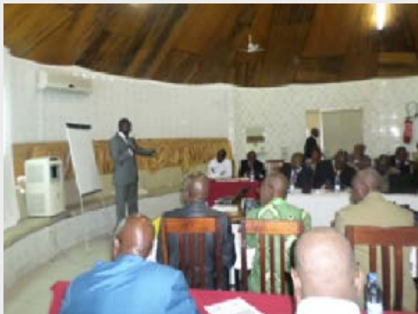
Training at Yamoussoukro / La formation à Yamoussoukro

Les superviseurs qui ont reçu cette formation auront accès à une plate-forme qui leur permettra de suivre les progrès des enseignants du primaire qui la recevront.