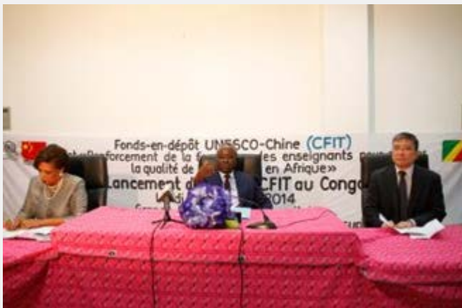
CFIT launch in Congo / Le lancement au Congo

Enfin, les travaux préparatoires à l'achat et à l'installation des équipements et du matériel d'apprentissage en ligne ont également été menés à bien.