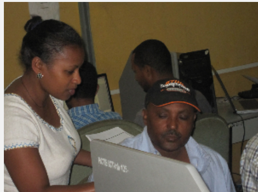
Training at Hawassa College for Teacher Education / La formation à Collège de formation d'enseignants d'Hawassa