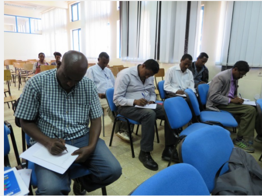
Training at Bahir Dar Univeristy / La formation à Université de Bahir Dar