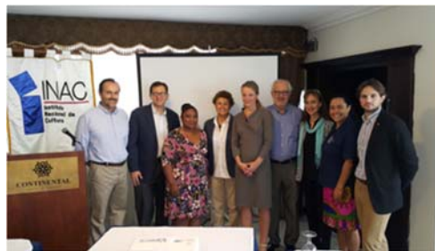
Figura 1.1: Los miembros de la Misión con representantes de la Administración panameña.