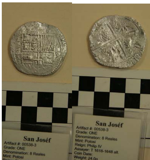
Figura 2.6. Anverso y reverso de moneda española de plata tipo macuquina (Pieza N° 538-3). A simple vista no se pueden apreciar detalles tales como el año de acuñación y la ceca, pero el diseño general corresponde al período en el cual naufragó el galeón San José .

arqueología general y subacuática, y se vienen utilizando desde hace varios años en América Latina 41 .