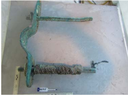
Figura 2.7.a. Pieza 00415 - IMDI, Informe Noviembre 2014.