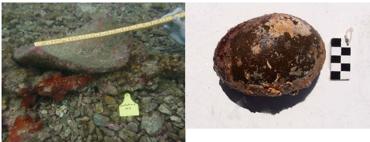
Figura 2.3. Sitio Contadora 1 – Fragmentos de recipientes cerámicos. Escala en las imágenes superiores : 30 cm. Foto derecha inferior: Canto rodado que podría formar parte del lastre de una embarcación. Escala: 5 cm.