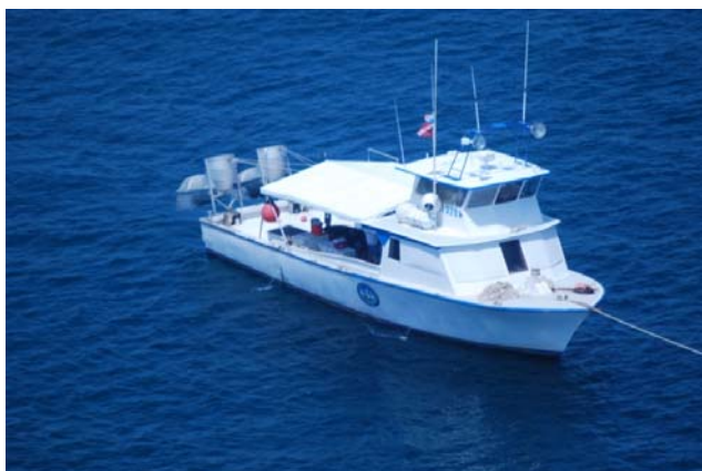
Figura 2.5.a. Arriba: Embarcación Blue Water Rose utilizada por IMDI. En la popa pueden apreciarse los deflectores de hélices utilizados en la excavación del sitio atribuido al pecio San José .