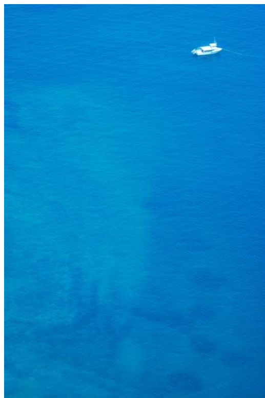
Figura 2.5.b. Derecha: Imagen aérea en la que pueden observarse los pozos circulares que han quedado en el subsuelo marino tras la utilización por parte de IMDI de los deflectores de hélices que producen potentes chorros de agua.

2.37 Las Normas 3 y 4 así como parte de la Normas 14 y 16 señalan que debe limitarse el impacto sobre el sitio. El proyecto de IMDI señala que “todas las actividades de rescate y salvamento serán ejecutadas por IMDI de acuerdo con los más estrictos procedimientos de protección al medio ambiente” 36 ; y se agrega que el equipo de trabajo incluye un consultor ambiental (el Dr. Peter J. Barile) quien “es el profesional que asesora al proyecto en todo lo concerniente al cuidado y preservación del medio ambiente, a fin de eliminar o reducir al máximo toda posibilidad de daño ambiental que pudiesen ocasionar las actividades de recuperación y salvamento” 37 . Sin embargo, la metodología de excavación empleada por IMDI 38 , consistente en la generación de potentes chorros de agua utilizando deflectores de hélices que remueven sedimento y por lo tanto “excavan” un sitio, ha producido un importante daño tanto al patrimonio arqueológico como a su entorno natural (Figuras 2.5.a y b). En su momento la prensa local también se hizo eco de la preocupación por el impacto negativo que las actividades de IMDI podían tener sobre los recursos culturales y naturales del archipiélago de Las Perlas 39 .