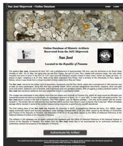
Captura de pantalla de la web de IMDI para “autenticar” objetos extraídos del sitio arqueológico.

2.31 Pero también se pone de manifiesto al acceder a la web de IMDI y la página de Facebook creada a tal efecto 33 . En ambas se pone de manifiesto la voluntad de la compañía de