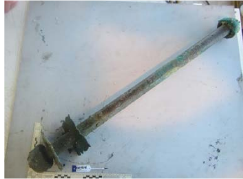
Figura 2.7.b. Pieza 00414. IMDI, Informe Noviembre 2014.

Sería necesario realizar una inspección directa de estas piezas, que la Misión sólo conoce a través de las fotos de IMDI, pero si las roscas fueran de tipo industrial no pueden provenir del galeón San José (ni de ninguna otra embarcación de la época).