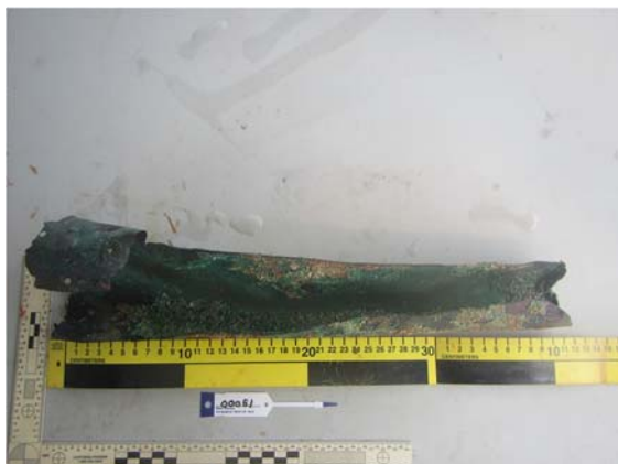
Figura 2.8. Pieza 00051, atribuida al galeón San José

española, fue recubierto con planchas de cobre en la década de 1780 48 . El punto relevante a señalar aquí es que la pieza 00051 atribuida al galeón San José —una lámina metálica que parece ser de cobre o aleación de cobre (Figura 2.8)— podría ser una plancha de revestimiento del casco, en virtud de su escaso espesor y de la presencia de orificios que corresponderían a la ubicación de tachuelas. No hemos tenido ocasión de ver la pieza original y la fotografía no permite corroborarlo, pero si se tratara de una plancha de revestimiento y fuera de cobre o alguna aleación con este metal, la misma pertenecería a un período cronológico posterior al naufragio del San José y en consecuencia no podría provenir de este pecio.