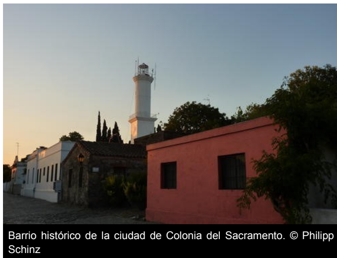
Barrio histórico de la ciudad de Colonia del Sacramento.

La Oficina de la UNESCO en Montevideo, la Comisión del Patrimonio Cultural de la Nación de Uruguay, el Ministerio de Educación y Cultura de Uruguay, Uruguay Natural y la Intendencia de Colonia organizaron entre el 4 y 6 de diciembre de 2015, una serie de actividades para conmemorar el vigésimo aniversario de la inscripción del Barrio Histórico de Colonia del Sacramento en la Lista del Patrimonio Mundial. La Oficina de la UNESCO en Quito y Representación para Bolivia, Colombia, Ecuador y Venezuela fue invitada a participar en la mesa redonda sobre la Convención de 1972 de la UNESCO y el Patrimonio Mundial en Uruguay con la ponencia “La Convención de 1972 y los retos de los centros históricos”, presentada por Alcira Sandoval Ruiz, Especialista Responsable del Sector Cultura de esta Oficina. ( Enlace a la ponencia ).