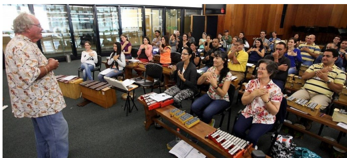
La Escuela de Formadores es un proyecto que busca la capacitación de docentes, estudiantes y emprendedores musicales que busquen replicar sus conocimientos en el área musical con públicos de toda la ciudad. Hacen parte de esta iniciativa 80 formadores capacitados en pedagogía musical para la primera infancia y 200 profesores que conforman el diplomado de técnicas para la enseñanza musical en Medellín. Foto:

Dic. 11/15. La Organización de las Naciones Unidas para la Educación, la Ciencia y la Cultura (UNESCO) incluyó hoy a Medellín en su Red de 116 Ciudades Creativas en la categoría "Música". Este es el reconocimiento internacional más importante que ha recibido la cultura de la ciudad y su sector artístico. Al ingresar a la Red, Medellín se compromete a colaborar y desarrollar alianzas para promover la creatividad y las industrias culturales, a compartir prácticas idóneas, a reforzar la participación en la vida cultural y a integrar la cultura en sus planes de desarrollo económico y social.