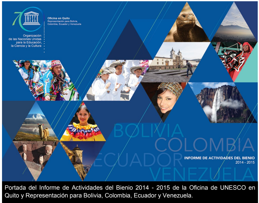
Portada del Informe de Actividades del Bienio 2014 - 2015 de la Oficina de UNESCO en Quito y Representación para Bolivia, Colombia, Ecuador y Venezuela.

La Oficina de UNESCO en Quito y Representación para Bolivia, Colombia, Ecuador y Venezuela, se complace en presentar el Informe de actividades del bienio 2014-2015 correspondiente al período comprendido entre los meses de febrero de 2014 y diciembre de 2015, en el marco de una especial coyuntura como fue el septuagésimo aniversario de la fundación de la UNESCO, Organización al servicio de la dignidad humana.