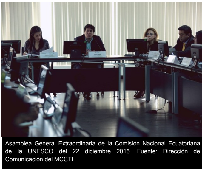
Asamblea General Extraordinaria de la Comisión Nacional Ecuatoriana de la UNESCO del 22 diciembre 2015.

La Comisión Nacional cumple con informar que, dentro de sus actividades y funciones, se ha asesorado y apoyado a la SETEC, Secretaría Técnica del Sistema Nacional de Cualificaciones y Capacitación Profesional, para que se convierta en Centro UNEVOC y forme parte de la Red UNEVOC. La postulación ha sido ya remitida. Esto con la finalidad de que este Centro Internacional de la UNESCO brinde asesoría y cooperación técnica a esta Secretaría Técnica en los temas de educación y formación técnica y profesional.