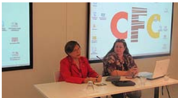
VIII Jornadas Cooperación Educativa

Se recibieron cuatro proyectos de pasantía, siendo aprobados tres que se desarrollaron durante el 2011