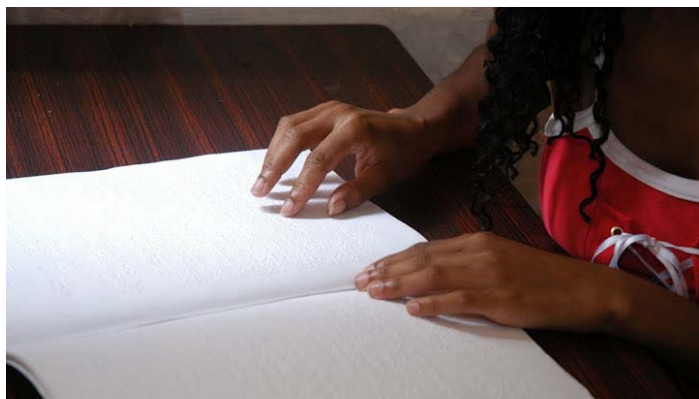
Lectura en Braille (Venezuela)

La educación inclusiva es un área prioritaria tanto para la UNESCO como para el Ministerio de Educación de España. Desde hace varios años el gobierno de España ha apoyado técnica y financieramente diversos proyectos en esta área.