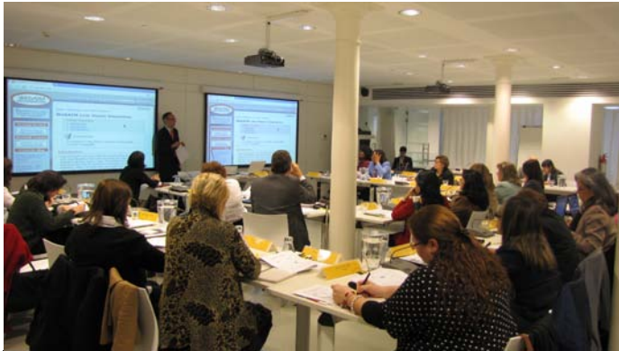
VIII Jornadas Cooperación Educativa

En la región de América Latina existe una creciente preocupación por la inclusión educativa, debido a las grandes desigualdades y la segmentación social y cultural presente en todos los países. En la RIINEE participan ministerios o secretarías de educación de los países de América Latina y España a través de sus departamentos o direcciones responsables de la educación especial y atención a la diversidad.