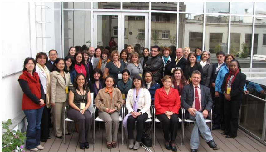
Los participantes de las VIII Jornadas en Montevideo, Uruguay

Dado que las VII Jornadas fueron financiadas por el Ministerio de Educación de España, los insumos del proyecto correspondientes a las Jornadas de 2010 no fueron utilizados durante ese año y se acordó utilizarlos en las VIII Jornadas en el 2011.