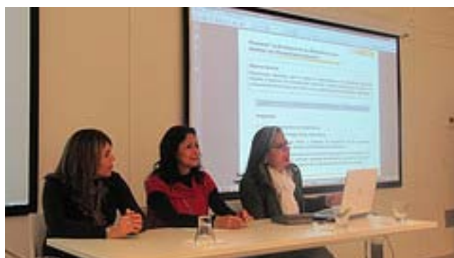
Secretarías de Educación de México y Guatemala.

Tres técnicos del Ministerio de Educación de Guatemala visitaron México donde pudieron conocer experiencias en desarrollo en centros educativos y participar en un programa de formación en enseñanza de las matemáticas.