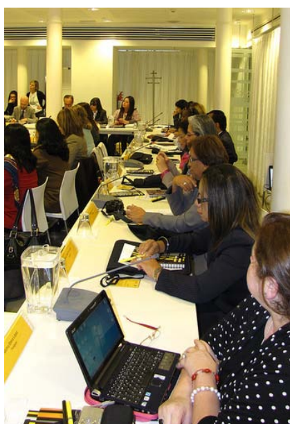
Participantes de las VIII Jornadas en Montevideo, Uruguay

Respecto al impacto, los países están dando mayor prioridad a la educación inclusiva y demandan apoyo técnico. Esto se evidencia en la presentación que los representantes de los países han hecho en las diversas jornadas y reuniones técnicas acerca de los avances en los marcos normativos y en sus políticas y programas de educación inclusiva. El reto es pasar de las declaraciones a las acciones a nivel de los centros educativos superando progresivamente el paradigma de la integración para avanzar hacia la inclusión.