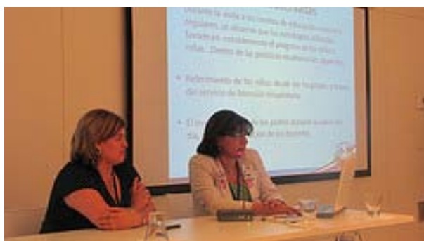
VIII Jornadas Cooperación Educativa.

Costa Rica-República Dominicana: “Atención temprana a niños y niñas de 0 a seis años que presentan discapacidad”.