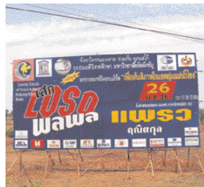
Объявление о концерте, на котором присутствовало около семи тысяч человек.