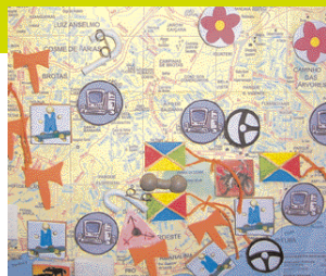
Хартия Салвадора-ди-Баия, Бразилия.