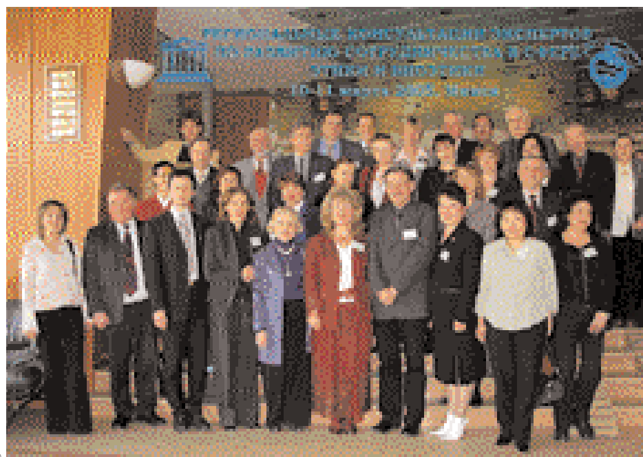
Участники консультаций в Минске, представлявшие шесть государств-членов СНГ и страны Балтии.