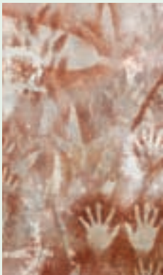
→ 澳大利亚中昆士兰卡那封峡谷的土著岩画