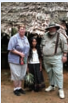
↑ 游客与南美一名印第安妇女在一起