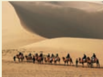
↑ 中国敦煌鸣沙山的一支驼队

文化间对话很大程度上取决于跨文化能力。跨文化能力是指与自己有别的人适当互动的一系列能力的综合。这些能力在本质上属于交际性能力，但也涉及调整改造我们看待和理解世界的方式；因为与其说是各种文化不如说是错综复杂和具有多重效忠对象的人--包括个人和群体--开展对话。