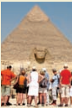
← 埃及吉萨狮身人面像前的游人