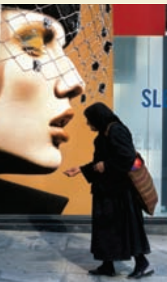
↑ 希腊雅典一个乞丐经过街头广告牌