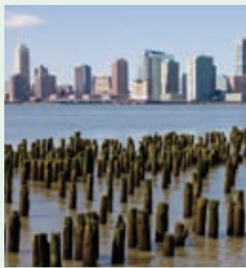
↑ 从美国德森河上看新泽西市的城市轮廓