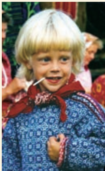
↑ 爱沙尼亚Kihnu岛上的一个小男孩

由此可见，各国应该立即行动起来，在促进文化多样性上投入更多的人力与财力。但是，这些投入应当用于哪些领域？目标又是什么？下文中的建议会为这些问题提供一些指导。这样的投资又会换来哪些回报呢？答案就是推动可持续发展，实现以“多样性统一”为基础的和平。这项行动所要付出的代价诚然很大，但“不作为的代价”却会更大。如果国际社会能够在今后的十年内坚持沿着这条道路前行，这份《世界报告》中所列出的各种方法就绝不会让各国失望。