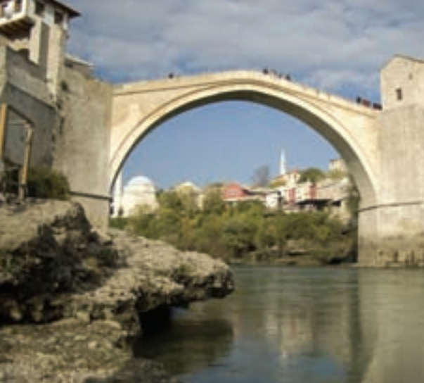
← 波斯尼亚战后重建 Mostar 大桥

目前，全球化进程正在促成更系统的文化碰撞、借用和交流。这些跨文化的新关联具有促进文化间对话的巨大潜能。重新思考文化所包含的种类，承认我们的特性可以有多种源头，都有助于把重点从“差异”转移到我们通过互动不断进步的共有能力之上。在通向文化间对话的道路上，牢记历史和理解文化编码也是帮助我们克服文化定型观念的关键。