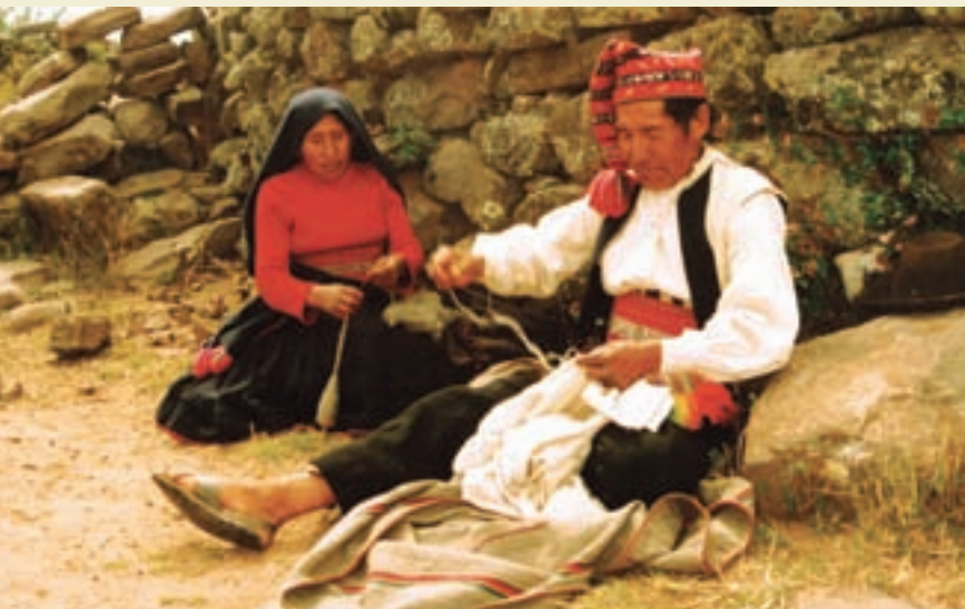
↑ 秘鲁的的喀喀湖塔奇拉上的编织工

文化间接触的增加，尤其是伴随着数字技术的进步，文化多样性的形式和语言的应用形式也因此大为丰富。因此，重点不是试图保存文化多样性的各种形式，而是应当制订新战略，不仅要考虑到这些变迁，还要使脆弱人们能够更加有效地“应对”文化变迁。每一种传承至今的传统都会经历自我改造的过程。文化多样性就如同文化特性一样，涉及革新、创造与接纳新的影响。