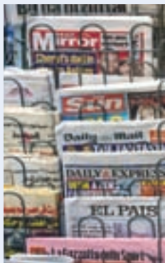
↑ 在英国牛津售卖的许多国家报纸

世界逐步转变成了一个“地球村”，新闻报刊、书籍、广播、电视、电影、网络以及各类数字设备在突出文化多样性与培养受众品位、价值观和世界观方面都发挥着不可小觑的作用。然而，这些表达方式到底能在多大程度上反映文化多样性的现实状况、复杂程度和多变性，却是值得商榷的。这是因为，尽管新媒体毫无疑问便于我们了解文化多样性，为文化间的对话和各种意见的发表创造更多机会，但数字鸿沟暗含的不对称仍旧制约着真正意义上的文化交流。而且选择的绝对数量和多样化与选择所体现的文化问题，恰恰可能导致各种形式的文化孤立主义与文化倒退现象。