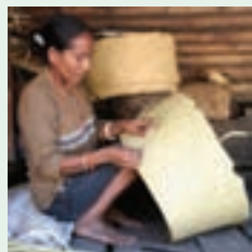
↑ 一位印度尼西亚妇女在编筐

从生物多样性减少到气候变化等一系列问题上,文化多样性都具有重要--尽管常常被低估--的作用,是应对当前生态学面临的挑战、保证环境可持续性的关键。各种文化