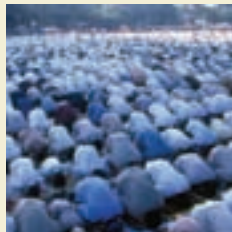
↑ 印度尼西亚雅加达穆斯林在祈祷