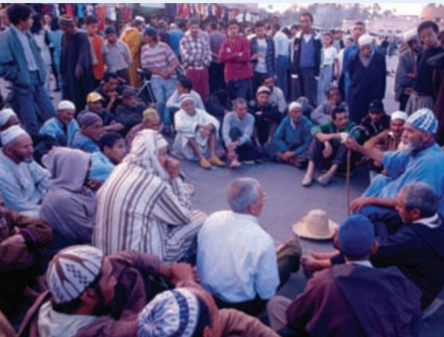
↑ 在摩洛哥马拉喀什 Jemaa el-Fna 广场上，说书人正在对一群人说书