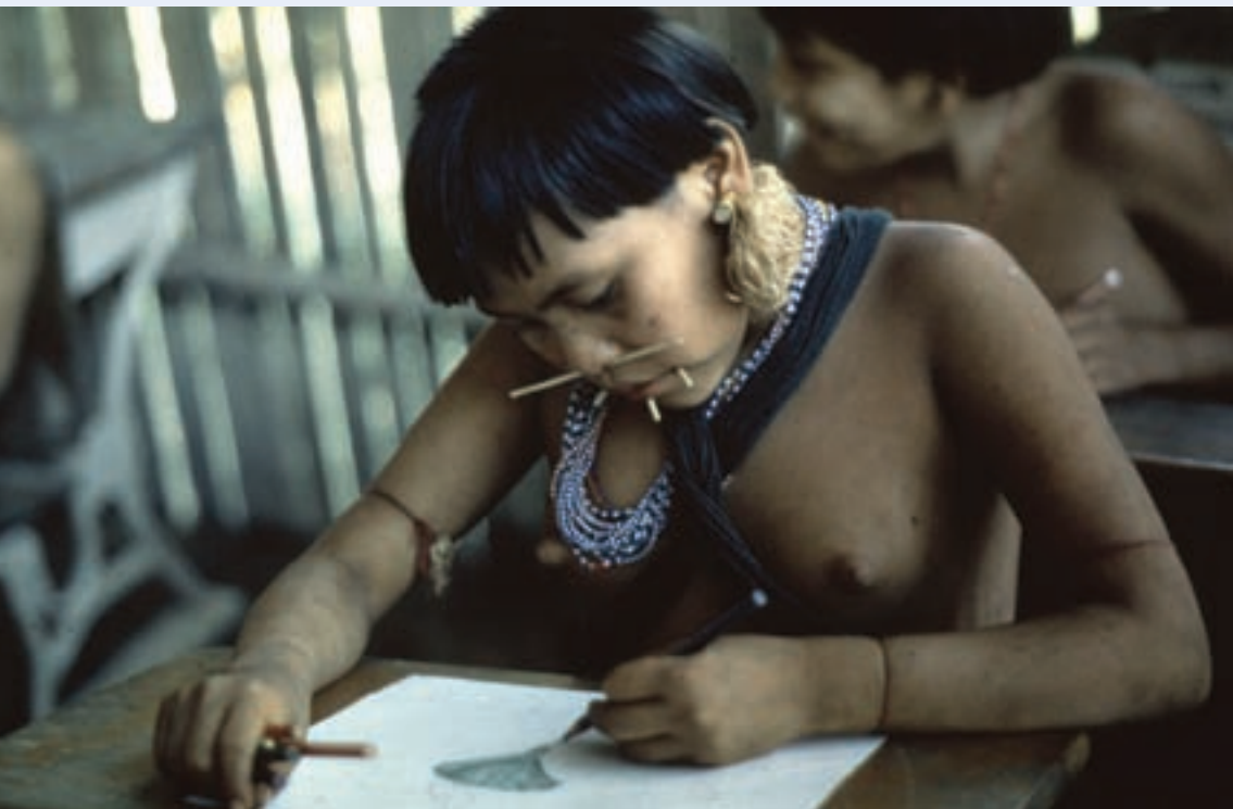
← 在委内瑞拉 High Orenoque, 一名土著小姑娘在教室里