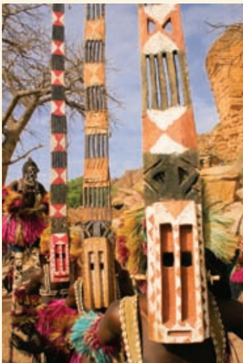
→ 马里Irelli村四名头戴面具、脚踩高跷的多贡族舞者

在对上述观念进行批驳的同时，《世界报告》也给出了强调文化多样性的动态特征的新方法。也就是说，促进文化多样性的政策不应该仅限于保护有形和无形遗产，也不应仅限于创造条件来激发创造力，还应该相关政策来帮助那些缺乏准备的弱势群体和个人应对文化变迁。