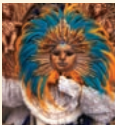
↑ 巴西里约热内卢狂欢节上的一个“太阳王”面具

← 一尊六世纪的巴比杨大佛，这是2001年被阿富汗塔利班政府摧毁的一个教科文组织世界遗产地