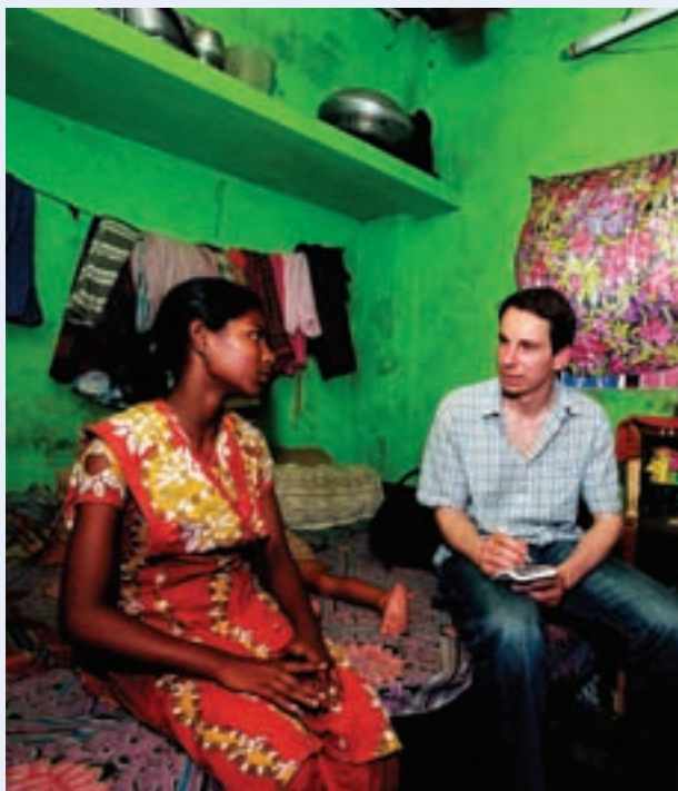
→ 一位年轻姑娘对德国记者谈在孟加拉国服装厂的工作情况