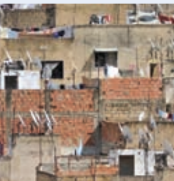
↑ 北非一座城市的屋顶

此外，较大规模的媒体和传播网络所能代表的群体是有限的，这往往通过通常所谓的“他者”过程助长定型观念的形成。媒体往往通过“他者”过程，遵循标准化节目和格式指令，固定、削弱或简化。目前，在多种旨在消除定型观念的战略中，媒体与信息素养倡议就有助于受众在进行媒体消费时提高辨别能力，避免片面的观点。媒体素养是利用媒体的一个重要方面，也是非正规教育的一个重要方面，应当在普通大众和媒体从业人员之中实施全面推广，以加深相互理解、促成文化间对话。