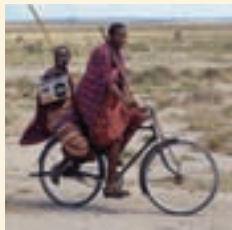
个 在坦桑尼亚阿鲁沙附近,两名男子骑一辆自行车

欲知更多信息,请查阅以下网址: to www.unesco.org/zh/world-reports/cultural-diversity 电子信箱: worldreport2@unesco.org