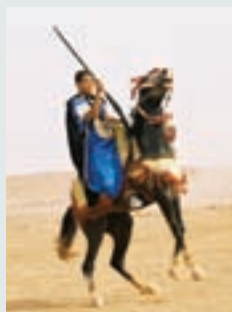
↑↑ 尼日利亚的一块移动电话接线员广告牌