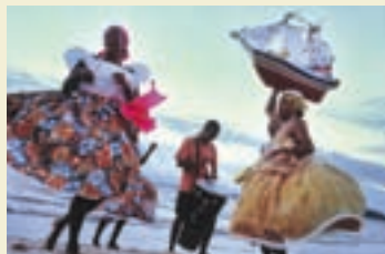
↓ 巴西巴伊亚州瑞康卡乌的圆圆桑巴舞