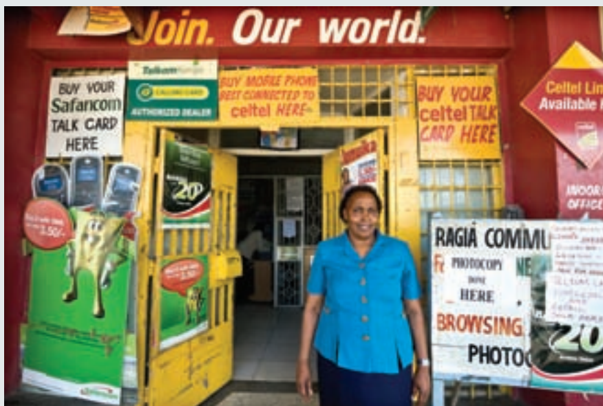
← 日本大阪一位身穿传统服装的僧侣