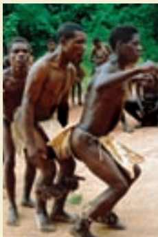
→ 中部非洲的阿卡俾格米人在唱复调