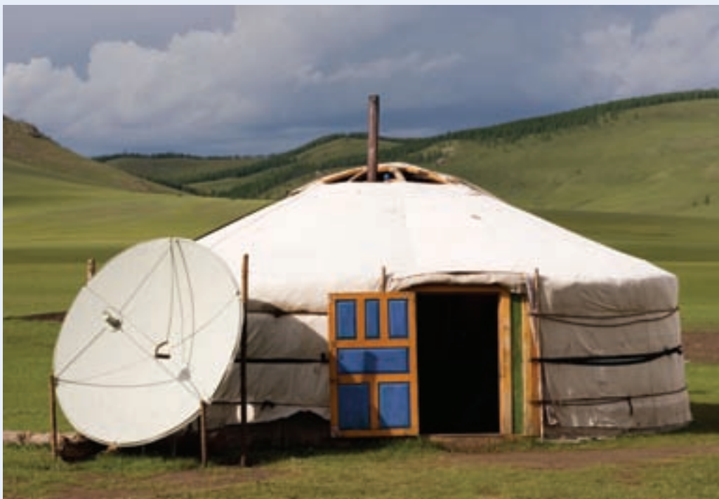
→ 在蒙古国一个蒙古包外的电视卫星接收天线

尽管如此，全球媒体版图已然出现了一些变化。一些发展中国家逐渐在文化和媒体设备出口、内容生产领域崭露头角，推动了所谓的“逆流”。发展中国家的文化和媒体设备出口量在1996-2005年之间迅速增长，原因之一是相关国家制订了增强全球