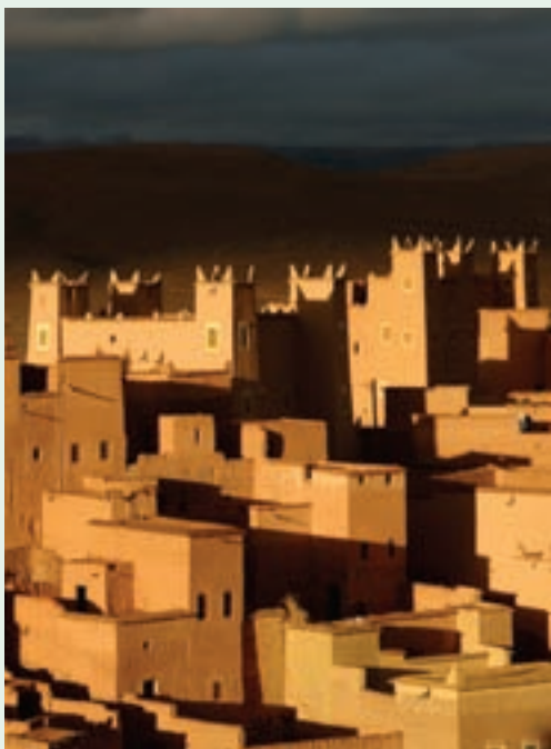
↑ 摩洛哥瓦尔扎扎特附近的阿伊特·本·哈杜筑垒镇