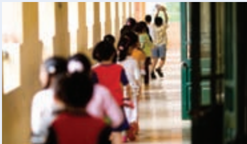
↑↑ 埃塞俄比亚南奥默的一所露天学校

在文化日趋多元化的各个社会群体内部，教育必须能够培养人们的跨文化能力，使我们在文化差异中和平相处