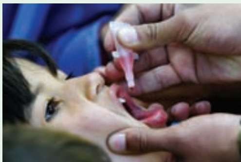
↑↑ 在莫桑比克马普托,儿童在当地的垃圾场玩耍