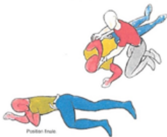
Imagen: Federación de socorristas franceses Cruz Blanca, ilustración de Jean-Pierre Danard