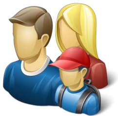
Учащиеся и Родители