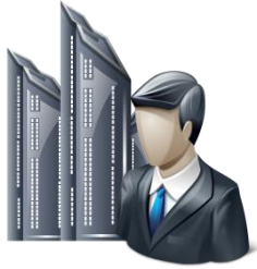
Сотрудники МОН РК