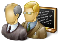
Директор Завуч Преподаватель