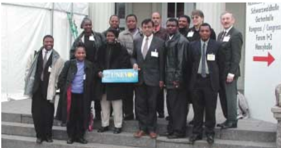
Participantes del seminario “África Meridional”

Los asistentes debatieron también las perspectivas para desarrollar un Sistema Nacional de Cualificaciones (SNC) y un Sistema Regional de Cualificaciones para los países agrupados en la SADC. El Centro Internacional UNESCO-UNEVOC y la Organización Internacional del Trabajo (OIT) están examinando actualmente métodos y medios para apoyar conjuntamente un proyecto de este tipo.