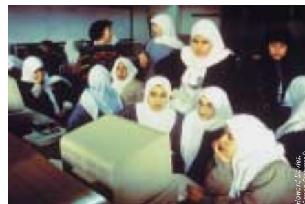
Ramallah, Cisjordania, Autoridad Palestina Instituto de Formación Femenino de la UNRWA

Para ilustrar la manera en que los institutos de FP consiguen mantener su actividad bajo estas circunstancias, exponemos las medidas tomadas por el Centro de Formación Femenino de Ramallah: