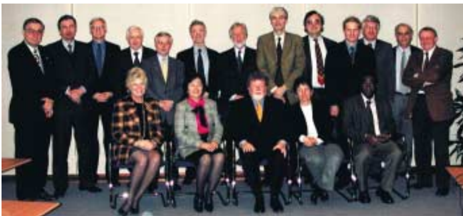
Directores de las Delegaciones e Institutos UNESCO de Europa reunidos para debatir una estrategia europea