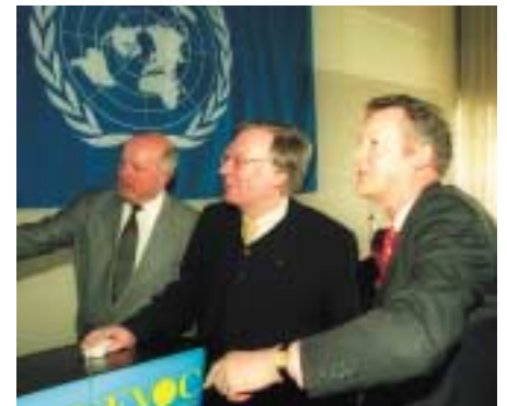
El Director General Adjunto de la UNESCO (a la derecha) envía el comunicado mundial de la inauguración, acompañado por el Director del Programa InFocus sobre Capacidades Profesionales, Conocimientos y Empleabilidad de la OIT (a la izquierda) y por el Presidente de la Comisión Alemana para la UNESCO (en el centro)

Al término de los diferentes discursos se llevó a cabo una inauguración oficial simbólica del Centro Internacional UNESCO-UNEVOC, pulsando las teclas que comandaban el envío de correos electrónicos a escala mundial con el anuncio de la apertura del Centro. Estos mensajes se remitían a Institutos, Centros y Dele-