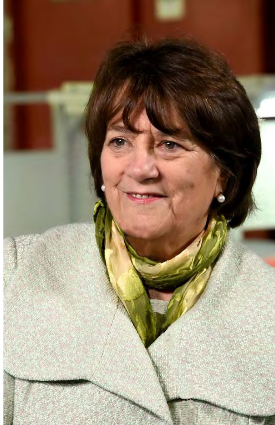
Adriana Delpiano Puelma Ministra de Educación

Experiencias como esta, nos permiten afirmar que podemos avanzar en la construcción de un país con mayor cohesión social, que responda a las necesidades de un Chile más justo y más próspero.