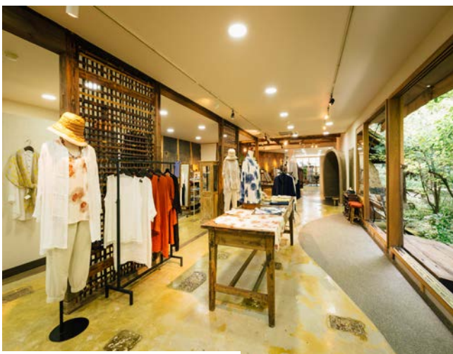
Gungendo Shop