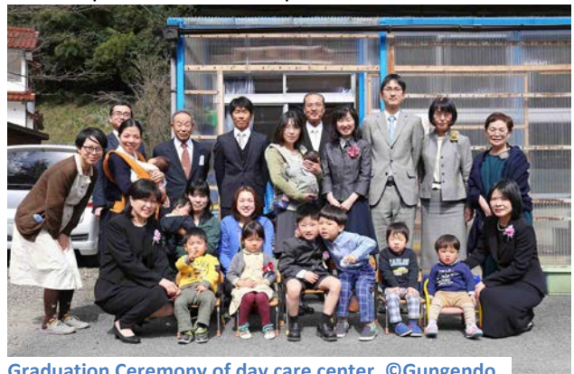
Graduation Ceremony of day care center @Gungendo

Autre signe d'évolution positive, Omori-cho connaît un baby-boom – cinq bébés l'année dernière, et sept cette année. En fait, dans le passé, l'École primaire Omori a connu à plusieurs reprises des périodes sans élève, si bien que les villageois ont financé un fonds pour maintenir le bâtiment, collectivement convaincus qu'un village n'est pas durable quand l'école ferme.