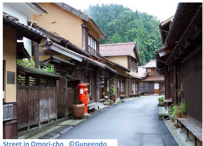
Street in Omori-cho

« Nous, les nouveaux arrivants, nous avons vu nos