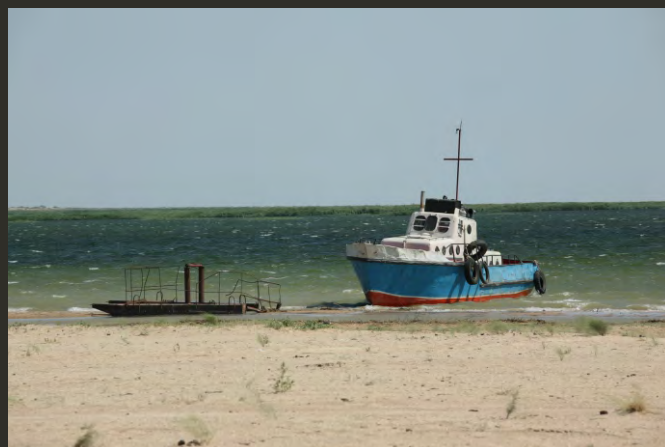
Переходная зона БР (побережье Малого Арала)

Биосферный резерват в целом управляется через Координационный совет, который был основан в 2014 г. До этого территория основной и коренной зон управлялась Научно-техническим советом