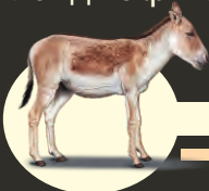
Биосферный резерват Барсакельмес