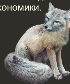
Vulpes corsac in winter