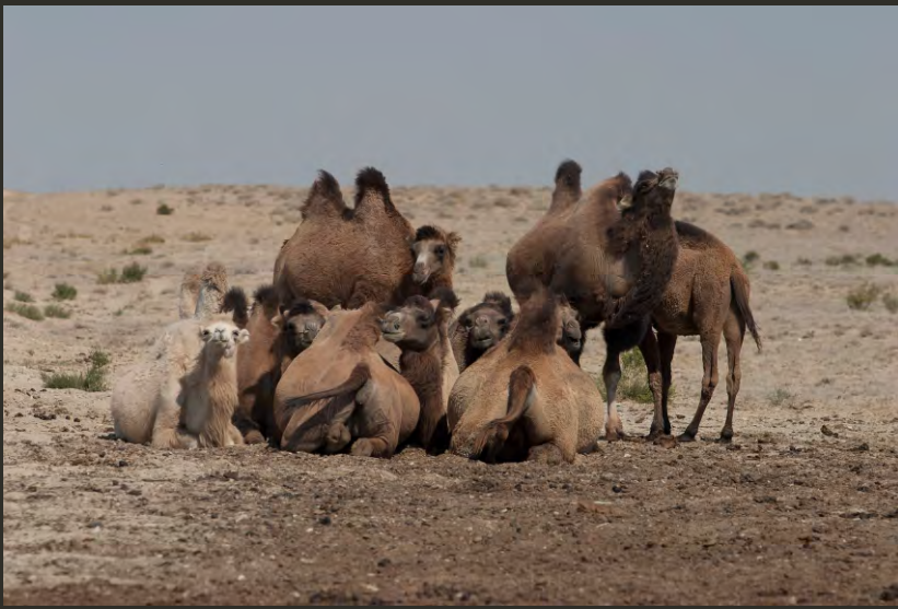
Двугорбый верблюд Camelus bactrianus