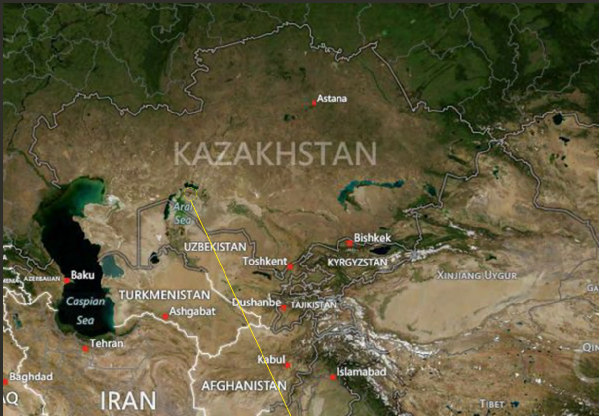
Биосферный резерват Барсакельмес

Общая площадь территории БР Барсакельмес составляет 407 132 га. Основная или коренная зона (территория государственного природного заповедника Барсакельмес) включает 160 826 га, буферная зона - 46 306.34 га, переходная (трансграничная) зона – около 200,000 га.