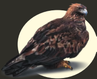
Биосферный резерват Барсакельмес

транзитной зоны БР в дельте реки Сырдарья зарегистрировано также: - 112 видов флоры, в том числе, ранее не охваченные охраной водные растения, из них 2 вида, занесенных в Красную книгу (камыш казахстанский и нимфейник щитолистный), которые в других участках заповедника не встречаются и, нигде более в Казахстане не охраняются; 85 видов зоопланктона из них 4 редких и 2 эндемичных; - 250 видов птиц, из них около 100 гнездящихся, в том числе 40 редких и эндемичных, 27 видов внесены в Красную книгу позвоночных животных РК, а 13 видов включены в Красный список МСОП (IUCN). Водно-болотные угодья Малого Арала, играют важнейшую роль как место остановок и отдыха на миграционном пути птиц, связывающем Сибирь с местами их зимовок в Южной и Передней Азии и Африке, поэтому они включены в международный список ключевых орнитологических территорий Казахстана (IBA). В период в миграции, здесь останавливается 20-50 тыс. водоплавающих и околоводных птиц, поэтому она соответствует международным критериям (A1, A4i b A4ii), в соответствии с которыми Малый Арал и новую дельту Сырдарии включили в список Рамсарской Конвенции как глобально значимые водно-болотные угодья международного значения; - 18 видов рыб, из 20, обитающих в Малом Арале, в том числе 3 редких