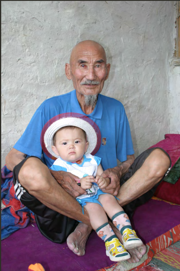
Бывший аральский рыбак с внуком, с. Каратерень