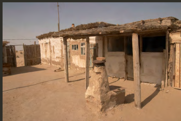
Жилой дом в трансграничной зоне БР

(спортивное) рыболовство; проведение наземных и авиационных работ по тушению лесных и степных пожаров; рекультивация нарушенных земель; восстановление лесных и иных растительных сообществ; восстановление среды обитания и численности диких животных; использование земельных участков для обустройства мест пребывания туристов, устройства питомников для искусственного размножения, выращивания, разведения эндемичных, редких и исчезающих видов растений и животных, а также строительство служебных зданий (кордонов) для проживания работников БР, предоставления им служебных земельных наделов.