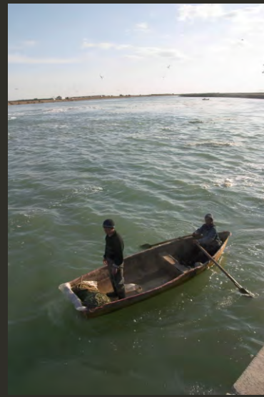
Рыбак в Малом Аральском Море

Сельское население, проживающее в дельтовых поселках в основном занимается рыбным промыслом. Рыбачьи поселки оказались расположенными вдалеке от мест лова, рыбачьи станы или лагеря не имеют постоянного местонахождения, в связи с нестабильным гидрологическим режимом моря. В настоящее время в Малом Аральском море на смену широкораспространённому в 1990-е годы виду камбала глосса Pletichthys flesus luscus , были восстановлены до промыслового уровня 16 видов рыб.