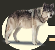
Биосферный резерват Барсакельмес

ограничения человеческой активности, здесь разрешены такие виды деятельности как туризм, научные исследования, образовательные программы, частичное использование природных возобновляемых ресурсов и т.д. Обе зоны служат для сохранения природных комплексов и частично для устойчивого развития. Переходная зона используется для жизни местного населения, развитие экономики, культуры и образования. Здесь нет строгого режима охраны природных комплексов, но есть некоторые ограничения на использование природы (экологически грязные производства запрещены). В целом, такое зонирование обеспечивает условия по преодолению конфликта между социально-экономическим развитием и сохранением природных комплексов и даёт возможность для стабильного развития экономики.