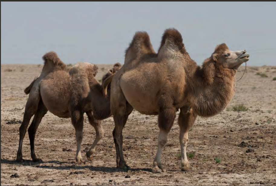
Самец двугорбового верблюда на водопое