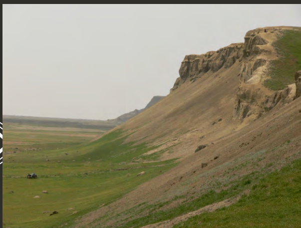
Переходная зона БР (бывший остров Кокарал)

государственного природного заповедника (до 2014). Координационный совет является коллегиальным общественным органом управления основанным для проведения политики эффективного управления и устойчивого развития природных ресурсов биосферного резервата, применения экологически дружелюбных энерго- и ресурсосберегающих технологий, а также восстанавливающих природную среду подходов.