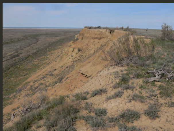
Основная зона БР (бывший остров Барсакельмес)