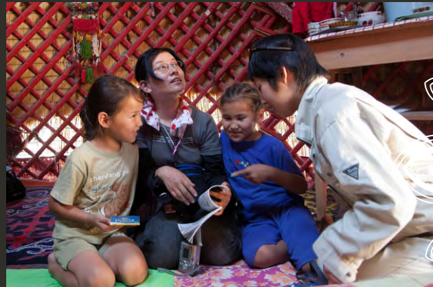
Японские студентки читают книгу с местными детьми