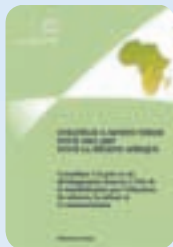
La stratégie à moyen terme pour 2002-2007 pour la région Afrique