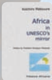
"Africa in UNESCO's mirror"