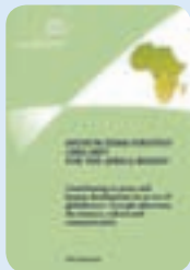
The Medium-Term Strategy for 2002-2007 for the Africa region