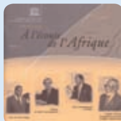
A l'écoute de l'Afrique 1 er numéro