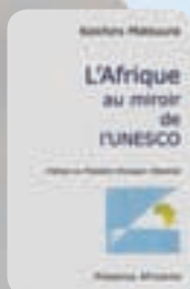
L'Afrique au miroir de l'UNESCO