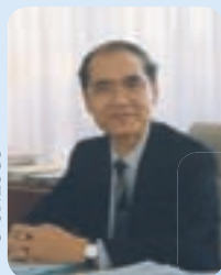
Président Konaré lors de sa visite à l'UNESCO (Mai 2005).