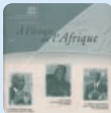
A l'écoute de l'Afrique 2 e numéro