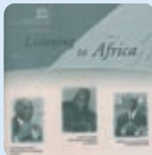
"Listening to Africa No 2"