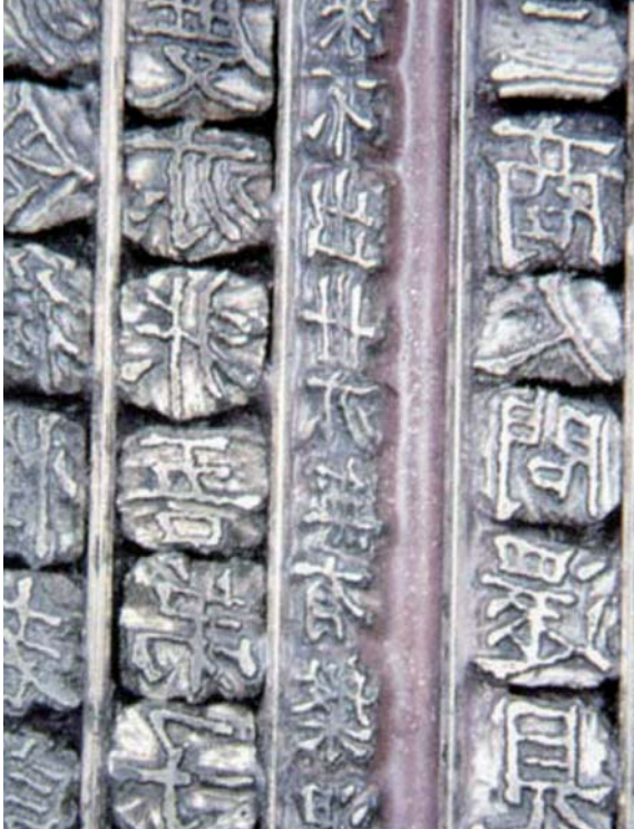
Restored metal type of Jikji

Le Prix a pour but de promouvoir les objectifs du Programme Mémoire du Monde et commémorer l'inscription au Registre de la Mémoire du Monde du Buljo jikji simche yojeol , le plus vieux livre existant connu dans le monde réalisé à l'aide de caractères métalliques mobiles.