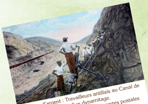
Hommes d'argent : Travailleurs antillais au Canal de Panama. Préparation d'un dynamitage.