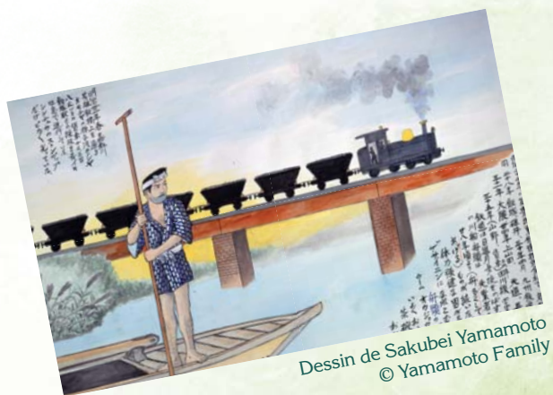
Dessin de Sakubei Yamamoto © Yamamoto Family