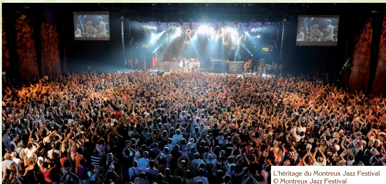
L'héritage du Montreux Jazz Festival