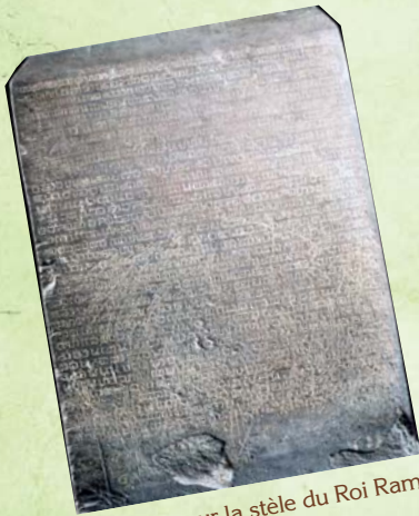
Inscription sur la stèle du Roi Ram Khamhaeng