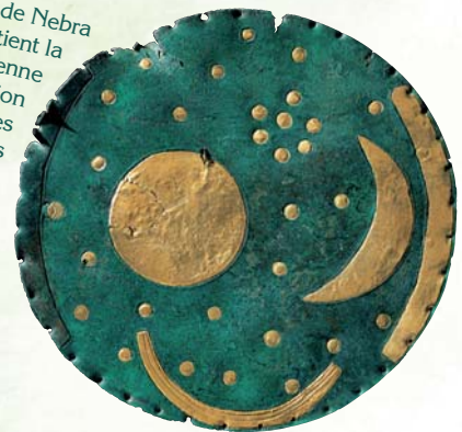
Le disque de Nebra qui contient la plus ancienne représentation concrète des phénomènes cosmiques à travers le monde.