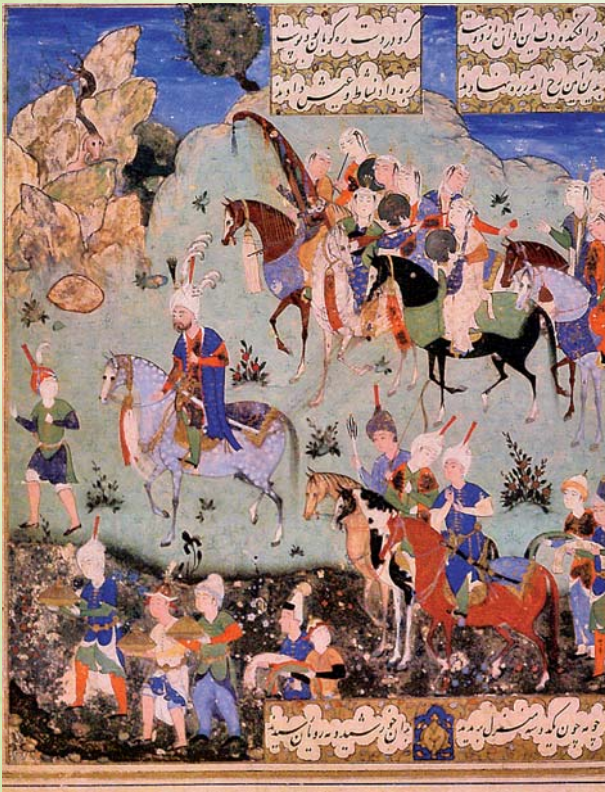
Laila rencontre Majnun dans le désert, 16 e siècle

C'est pourquoi l'UNESCO a lancé en 1992 le programme Mémoire du Monde.