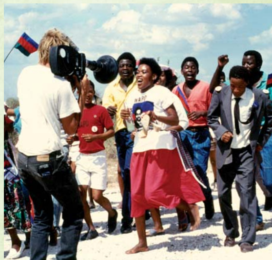
Rassemblement politique pour le Parti SWAPO, Namibie