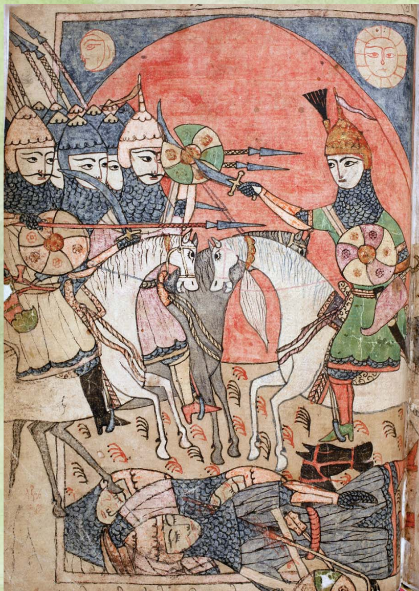
Collection de manuscrits du poème de Shota Rustaveli « Le chevalier à la peau de panthère »

7, place de Fontenoy 75352 Paris Cedex 15 Tél. 01 45 68 44 97