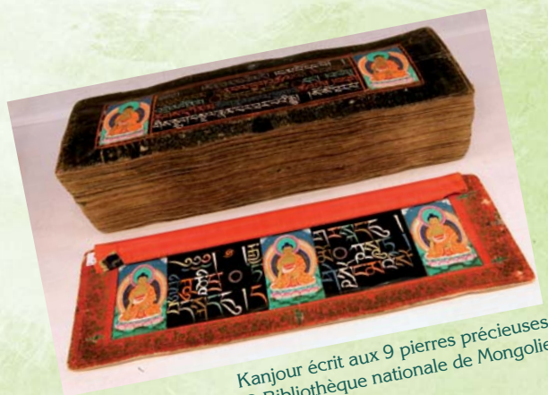
Kanjour écrit aux 9 pierres précieuses

Le patrimoine documentaire conservé dans les bibliothèques, les archives et les musées représente une partie essentielle de la mémoire collective. Il reflète la diversité des