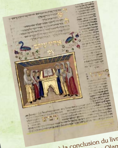
Illustration à la conclusion du livre des prières : l'hymne Adon Olam (Le Seigneur du monde). Folio 274vb. Recueil de Rothschild