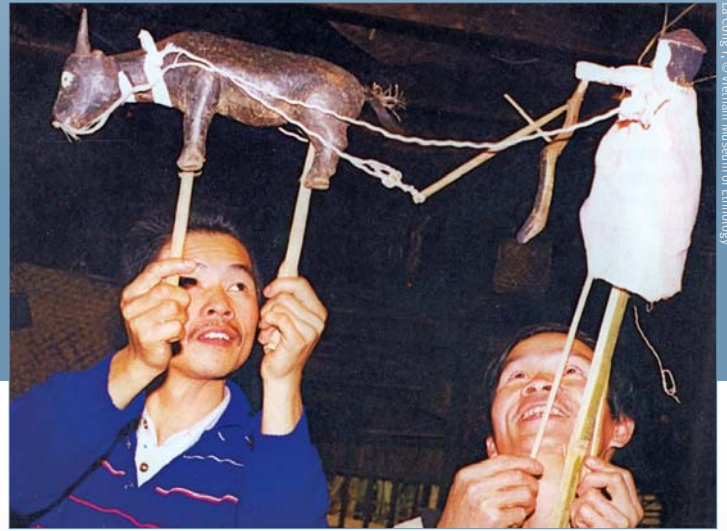
La Cong Y.