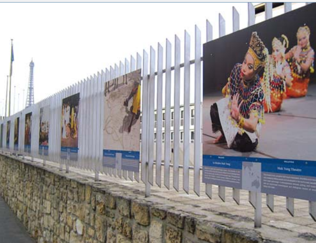
Papi za Picha kwenye Barabara ya Ségur.

Kwa maelezo zaidi, wasiliana na: ich@unesco.org