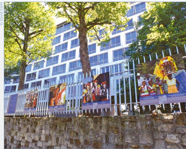
Papi za picha mbeke ya lango la UNESCO.