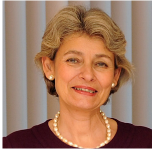
Irina Bokova Director-General of UNESCO

The UNESCO-Sharjah Prize demonstrates the shared determination of UNESCO and the Emirate of Sharjah to promote Arab culture and raise awareness of its immense contribution to world culture.