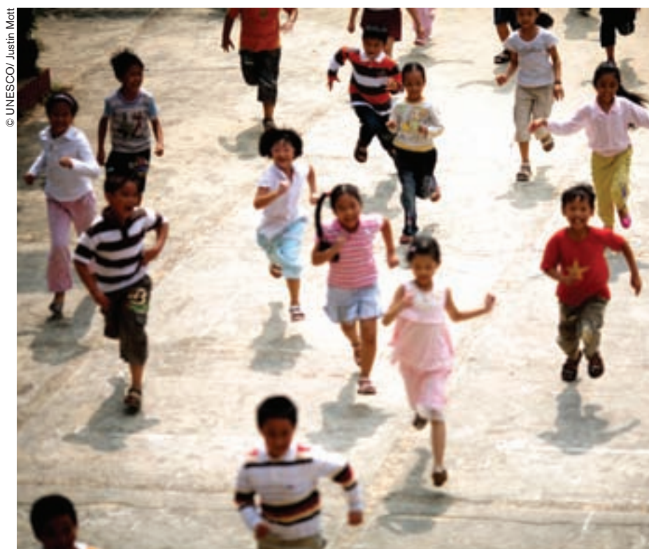
Privar al niño de la lengua materna en el hogar es crear una situación conflictiva entre el modelo familiar y el modelo social.

Los últimos veinte años de investigaciones en psicolingüística y sociolingüística demostraron sin