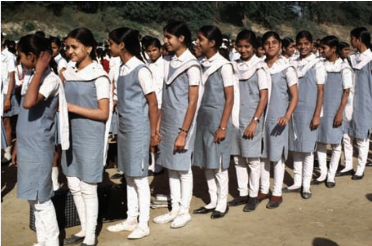
Escuela secundaria de Nueva Delhi.