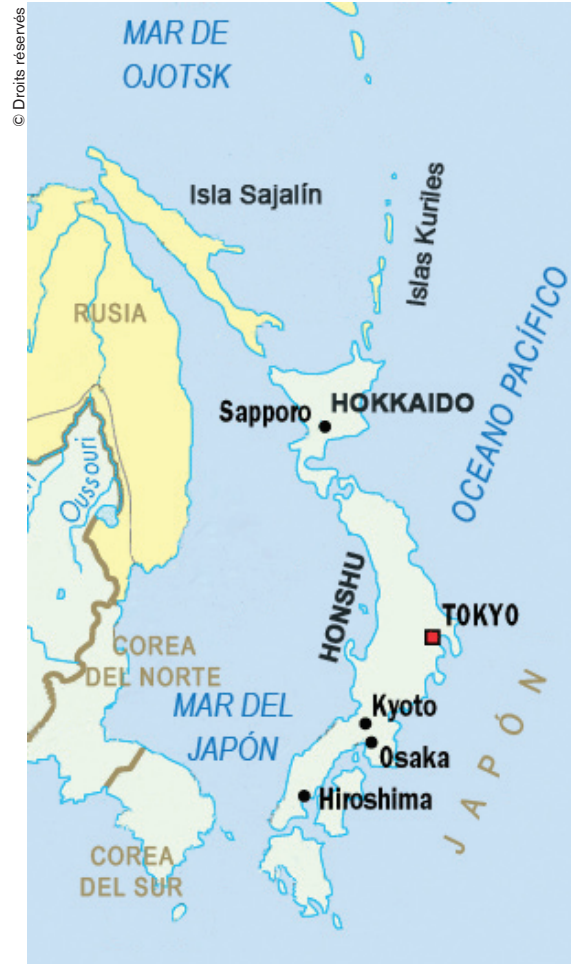
En el pasado, los ainu vivían en la parte septentrional del archipiélago japonés.

La lengua ainu, hablada en el norte de Japón y varias veces milenaria, corría el riesgo de desaparecer debido a la presión política del poder central. A fines del siglo XX se produjo una tendencia contraria. Pero, al no ser enseñado en los colegios, el porvenir del ainu es incierto. Sin embargo, el aumento de interés por este idioma es incontestable.