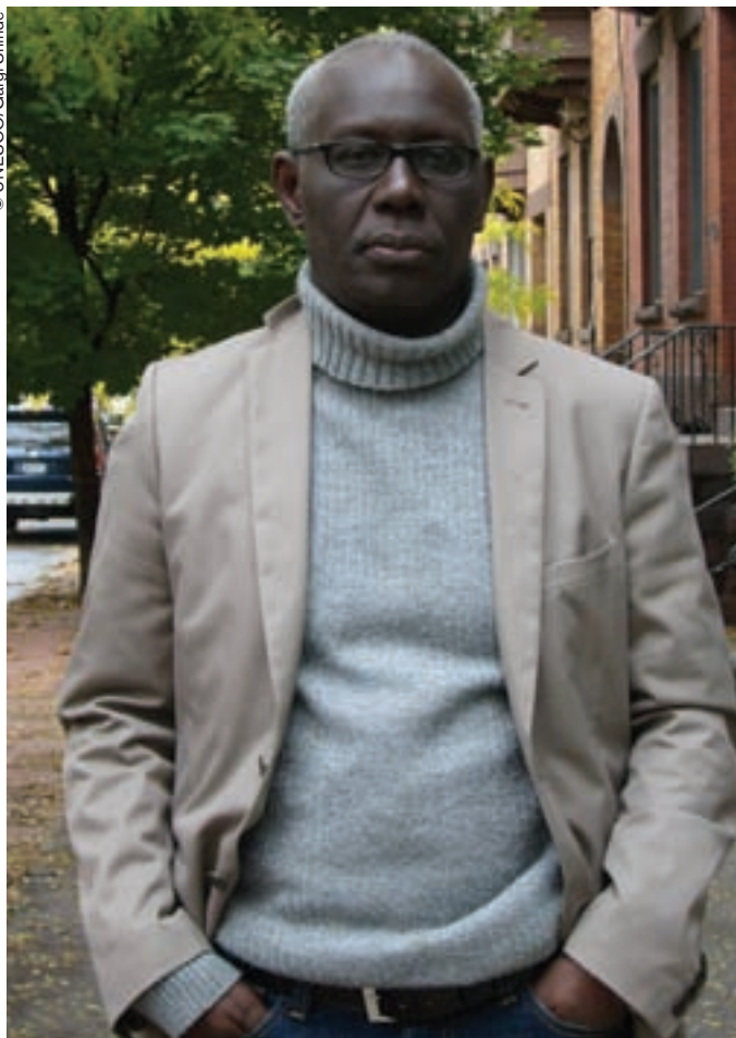
Boubacar Boris Diop.