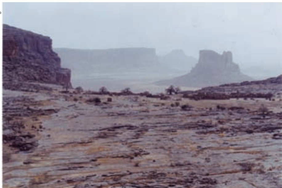
Para los habitantes de Koyo, la cima de la montaña encarna la palabra en toda su fuerza. El poder de la palabra se debilita a medida que se baja la pendiente.