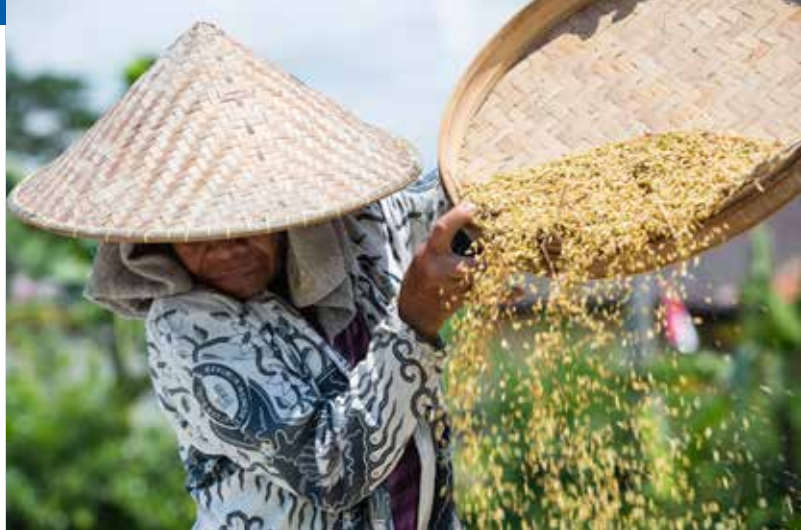
Riziculteur à Ubud, sur l'île de Bali, en Indonésie

En résumé, 78% des emplois dans le monde dépendent de l'eau.