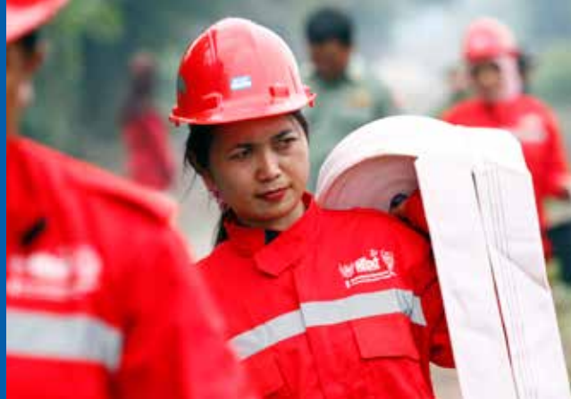
Pompier durant un exercice d'incendie dans le village de Garantung, à Palangkaraya, dans la province de Kalimantan Central, en Indonésie

L'analyse qualitative indique que la participation des femmes dans la gestion des ressources en eau et des infrastructures d'eau peut améliorer l'efficacité et accroître les rendements