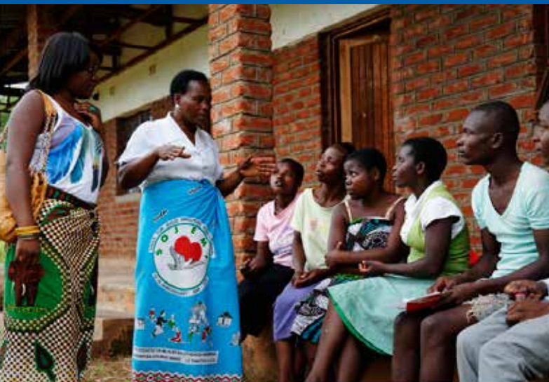
Travailleurs sociaux en discussion