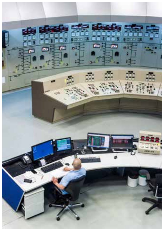
Salle de commande d'une centrale hydroélectrique

Il est essentiel que les investissements liés à l'eau soient conçus conjointement avec les secteurs connexes, tels que l'agriculture, l'énergie et l'industrie, afin de maximiser les résultats positifs en termes de croissance et d'emploi. Dans un cadre réglementaire adéquat, les partenariats public-privé (PPP) offrent un potentiel pour les investissements indispensables dans les secteurs liés à l'eau, y compris dans la construction et l'exécution de l'infrastructure d'irrigation et l'infrastructure pour l'approvisionnement, la distribution et le traitement de l'eau. Afin de promouvoir la croissance économique, la réduction de la pauvreté et la viabilité environnementale, il est nécessaire d'évaluer quelles méthodes atténueraient la perte ou la délocalisation d'emplois dûs à la mise en œuvre d'une approche intégrée dans la gestion de l'eau.