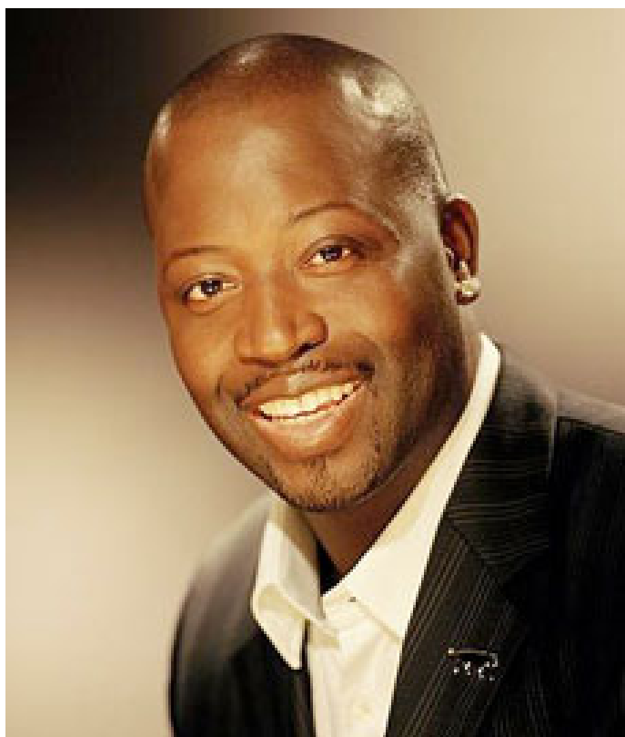
Malamine KONÉ 42 ans Président-fondateur de la marque « Airness » (France / Mali)

Militante du Parti Socialiste (PS), conseillère municipale de la ville de Lyon de 2008 à 2013, elle fut la porte-parole de Ségolène Royal, candidate du PS à l'élection à la Présidence de la République française de 2007, puis de nouveau sa porte-parole, entre 2009 et 2011, lorsque cette dernière fut candidate aux Primaires du PS pour l'élection présidentielle de 2012. En novembre 2011, François Hollande, désigné candidat du PS pour cette élection, la nomme porte-parole de sa campagne présidentielle. En mai 2012, elle est nommée Ministre des Droits des femmes et Porte-parole du Gouvernement français.