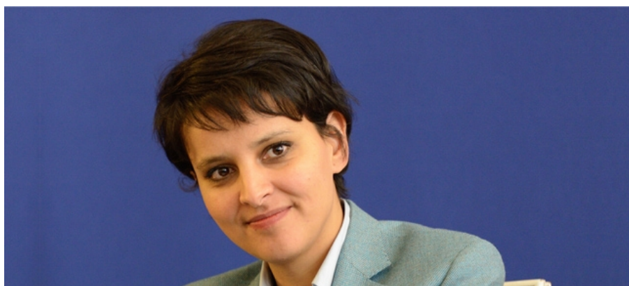
Najat VALLAUD-BELKAÇEM [à confirmer] 36 ans Ministre des Droits des femmes et Porte-Parole du Gouvernement (France)

Née au Maroc, Najat Vallaud-Belkacem est diplômée de l'Institut d'Études politiques de Paris et titulaire d'une Licence en droit public.