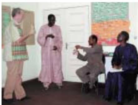
Quelques participants de l'atelier UNESCO-UNEVOC à Dakar, mai 2002.

Parallèlement à la notion d'élargissement géographique, il pourrait être nécessaire d'élargir également les thèmes à aborder pour prendre en compte les intérêts divers de tous les pays concernés. Des discussions sur les thèmes qu'il conviendrait d'aborder dans le cadre de la coopération sous-régionale ont déjà eu lieu pendant l'atelier. Les participants ont souligné que les systèmes d'EFTP de leurs pays pourraient dans les domaines suivants bénéficier de la coopération sous-régionale: relations école-entreprise, approche basée sur les compétences, diversification des sources de financement