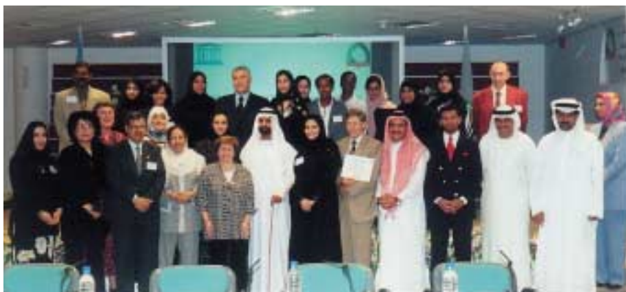
Participants à l'atelier sur l'EFTP et la contribution socio-économique des femmes dans les pays arabes, Dubaï, mai 2002.

Cette Table ronde avait été organisée pour coïncider avec la rencontre des Ministres de l'emploi et du travail du G8, réunis pour discuter du thème «L'impératif du savoir: les défis en matière de compétences et d'apprentissage au 21 e siècle». Le Directeur général de l'OIT avait été invité à présenter un exposé et à animer une session de la réunion des ministres du G8. Des représentants des gouvernements des pays du G8, des décideurs de pays en développement sélectionnés, des représentants d'organisations syndicales et patronales, de l'Union européenne et de l'UNESCO ont participé à la Table ronde de l'OIT. La discussion s'est concentrée sur les défis du développement du savoir et des compétences tels qu'ils figurent dans l'Agenda global pour l'emploi de l'OIT, de même que sur les systèmes de reconnaissance des compétences et les cadres de qualifications