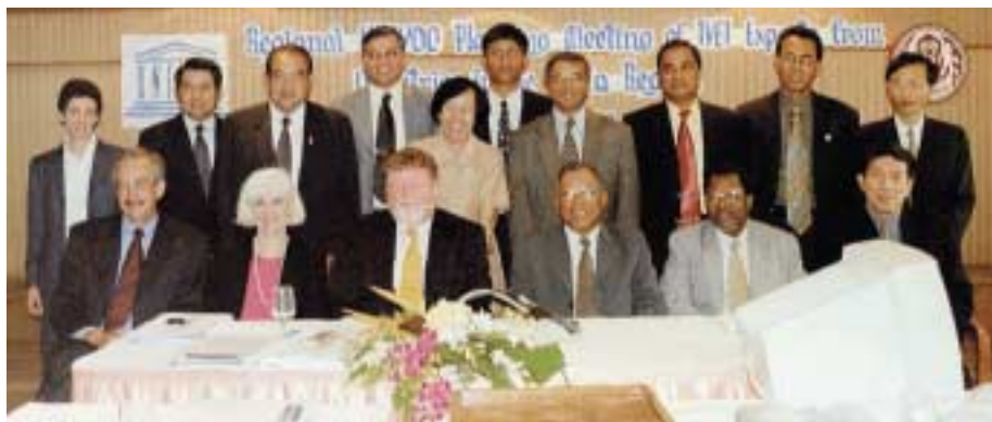
Réunion préparatoire pour l'Asie à Bangkok, 22 au 24 mai 2002.

Le Centre international UNESCO-UNEVOC («le Centre») est d'avis que les pays concernés ont tout bénéfice à tirer du renforcement de leurs contacts et de l'accrois-