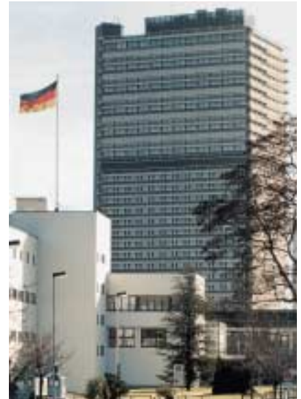
Les nouveaux locaux du Centre international UNESCO-UNEVOG (à gauche) et les anciens locaux au septième étage (à l'arrière-plan).

Tél. [+49] (228) 24337-0 Fax [+49] (228) 2433777 Courrier électronique: info@unevoc.de