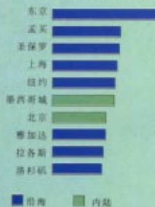
世界人口最多的十个超大城市