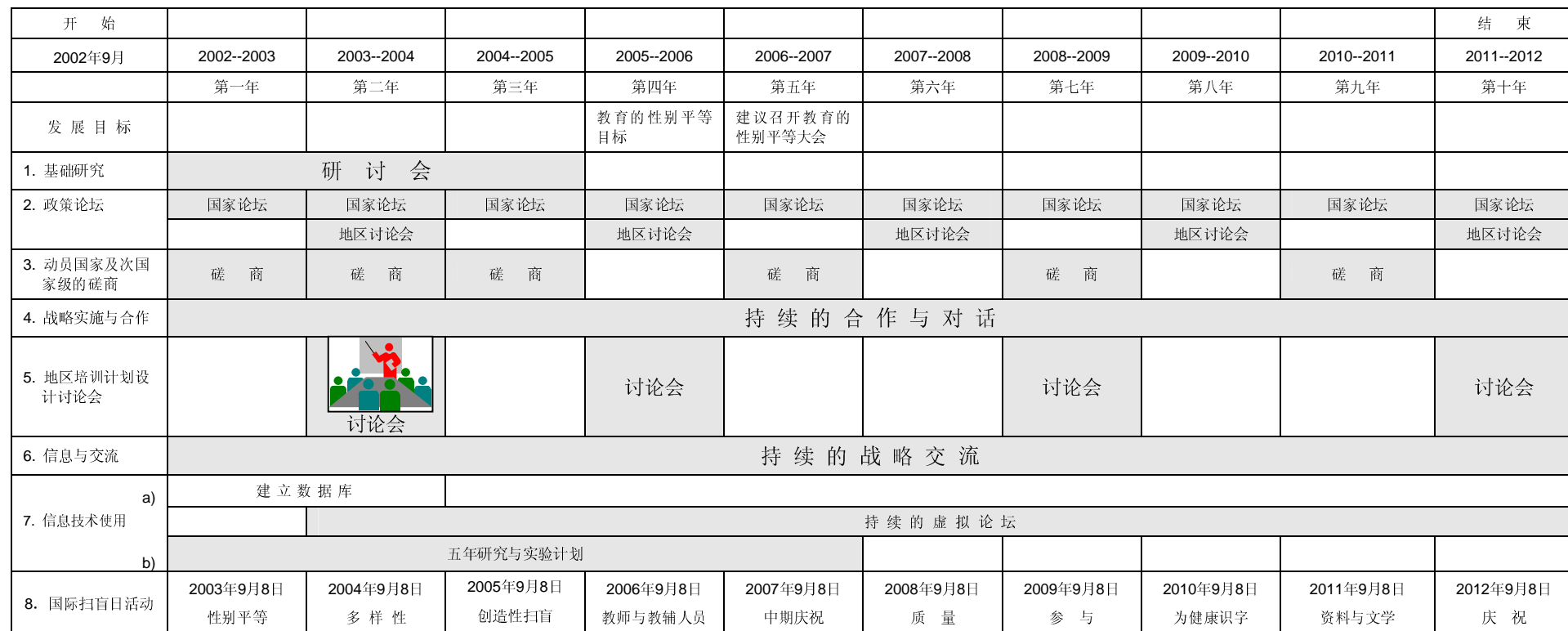
“十年”活动及事件的建议的时间表