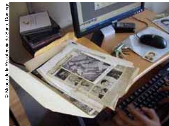
Archivo en el Museo de la Resistencia de Santo Domingo.

Unos 150.000 objetos o documentos fueron reunidos testimoniando el funcionamiento de la dictadura pero también la lucha de los dominicanos por la libertad y la democracia