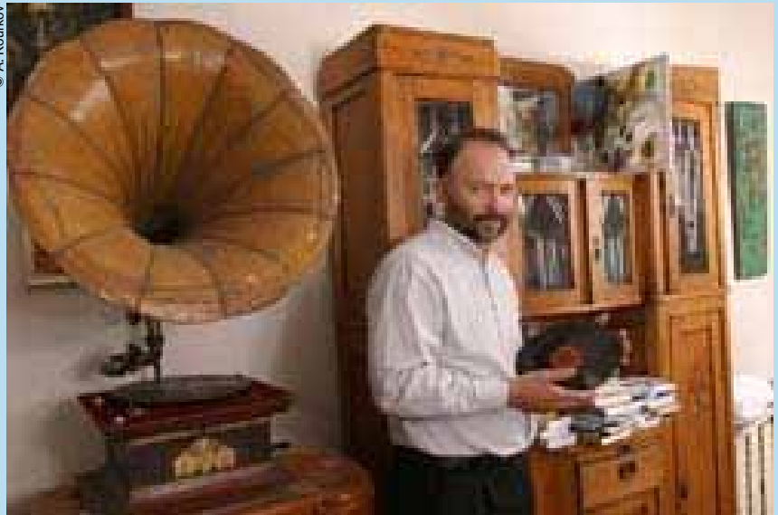
Andrei Kurkov en su “taller”, un apartamento en el que trabaja, en Kiev.