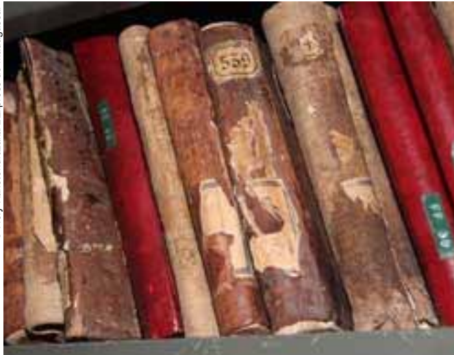
Volúmenes de los Archivos Reales cerrados al público.