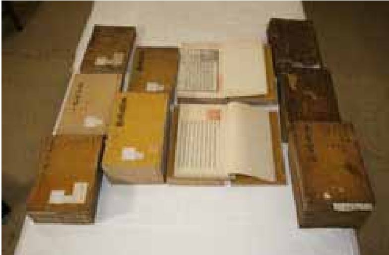
Los volúmenes originales del Donguibogam se conservan en la Biblioteca Nacional de Corea.

riñones, el corazón y el bazo, y de la acción diferente de cada una de estas vísceras en función de sus vínculos con las demás”.