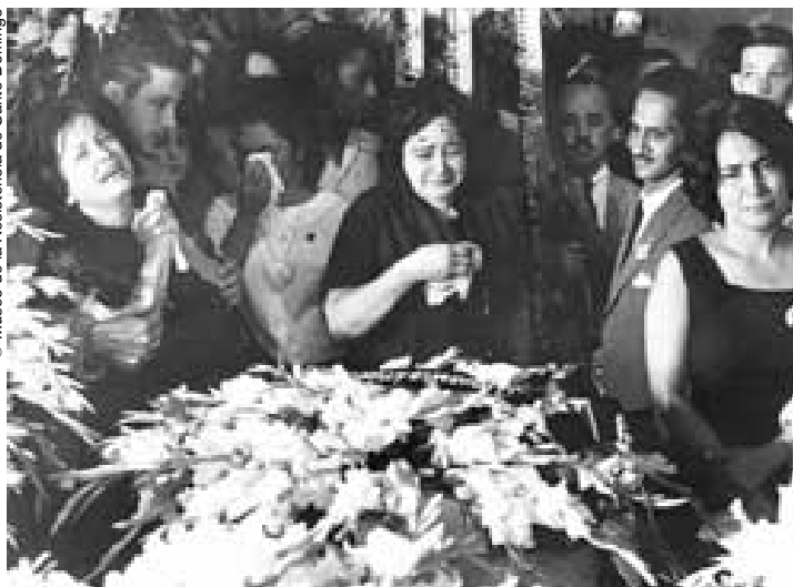
Mujeres llorando sus muertos.