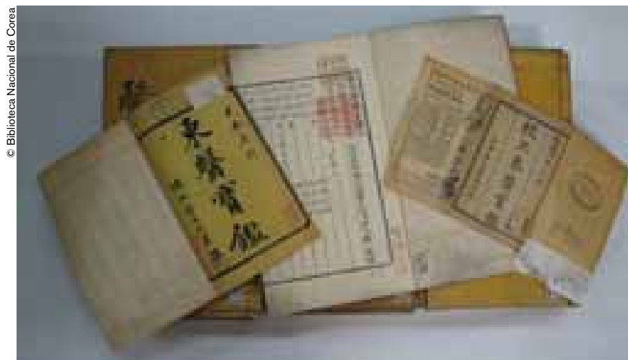
Volúmenes del Donguibogam, obra de la cultura clásica coreana.

“Todas las prácticas de la medicina tradicional en nuestro país están consignadas en el Donguibogam y se derivan de este libro a la vez”. Hwang Kyeong-sik, profesor de filosofía de la Universidad de Seúl, comenzó con estas palabras la ponencia que presentó en la conferencia científica internacional dedicada al examen de esta obra extraordinaria. Este evento tuvo lugar el 3 de septiembre de 2009 en la Biblioteca Nacional de Corea, con motivo de la celebración del cuarto centenario del Donguibogam y de su reciente inscripción en el Registro “Memoria del Mundo” de la UNESCO. Es el primer libro de medicina inscrito en este prestigioso catálogo.