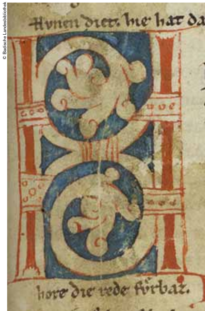
Iluminación del manuscrito del Cantar de los Nibelungos.

periodista del Spiegel Online (Alemania), corresponsal del Correo de la UNESCO