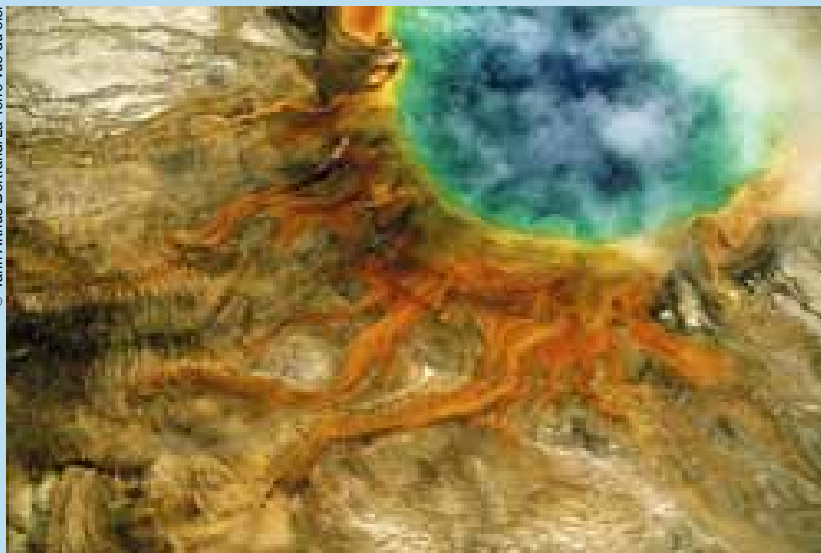
La fuente de agua caliente "Grand Prismatic" en el Parque Nacional de Yellowstone (Estados Unidos).