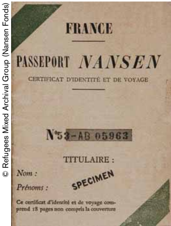
Pasaporte Nansen para los refugiados (1922).

logró que unos 450.000 prisioneros de 26 países pudieran regresar a sus hogares. En 1922, se creó el “pasaporte Nansen” que fue el primer documento de identidad internacional para personas desplazadas. Este pasaporte iba a aliviar la situación de centenares de miles de personas, facilitando primero la acogida en otros países de los refugiados rusos, así como de los armenios, asirios y griegos expulsados de Turquía, y permitiendo luego, en el decenio de 1930, el asilo de refugiados procedentes de Alemania, Austria y Checoslovaquia. Esta acción humanitaria fue la precursora de la que hoy lleva a cabo la Oficina del Alto Comisionado de las Naciones Unidas para los Refugiados (ACNUR).