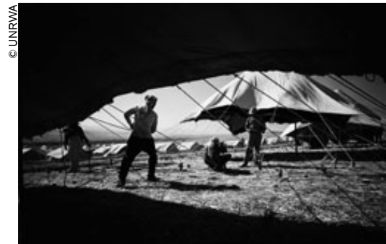
Campo de refugiados palestinos instalado en la ribera oriental del Jordán por el Organismo de Obras Públicas y Socorro de las Naciones Unidas para los Refugiados de Palestina en el Cercano Oriente (OOPS).

Los archivos de otras organizaciones internacionales son también muy valiosos porque poseen una copiosa documentación sobre la defensa de los derechos humanos, la lucha contra las enfermedades, la legislación laboral, la situación de la