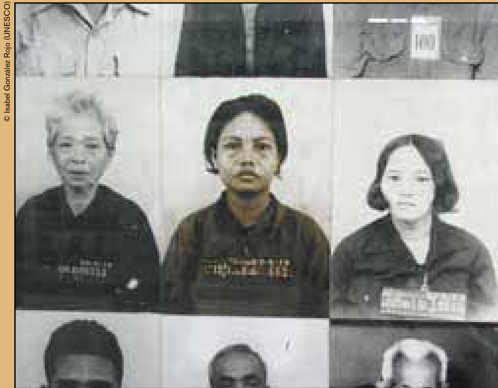
Presas en la S-21.