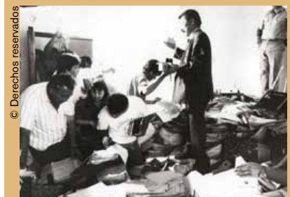
Martín Almada en el momento de descubrirse los llamados Archivos del Terror, el 22 de diciembre de 1992 en Lambaré, una localidad de las afueras de Asunción (Paraguay).

actual director de la Fundación Celestina Pérez de Almada, dedicada a la defensa de los derechos humanos y la protección del medio ambiente. Esta fundación recibió en 2005 el Premio Europa Solar en Berlín (Alemania).