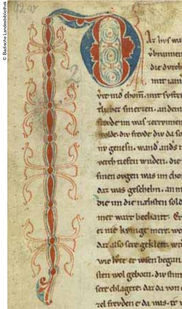
Ejemplo de inicial del manuscrito.

"Fue una verdadera mutilación del texto medieval", estima Ute Obhof. A todas luces el mariscal nazi