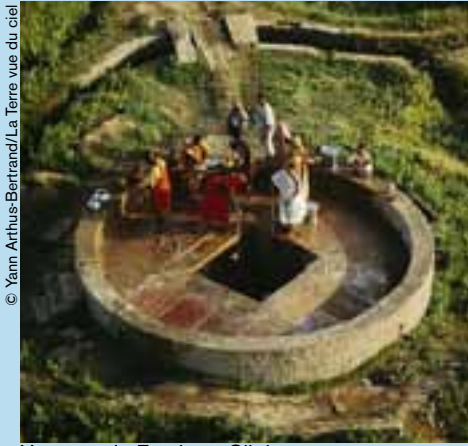
Un pozo de Fatehpur Sikri (Estado de Uttar Pradesh – India).

Con motivo de la Conferencia Mundial de Copenhague, El Correo dedica su número de diciembre de 2009-enero de 2010 al cambio climático.