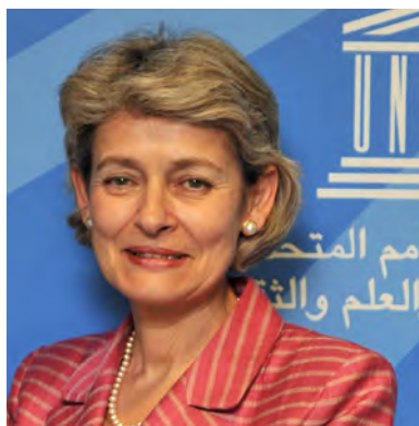
por Irina Bokova , Directora General de la UNESCO

La UNESCO es la agencia de las Naciones Unidas encargada de promover la educación física y el deporte a través de una acción concertada, colaborativa y participativa para apoyar el desarrollo integral de cada individuo.